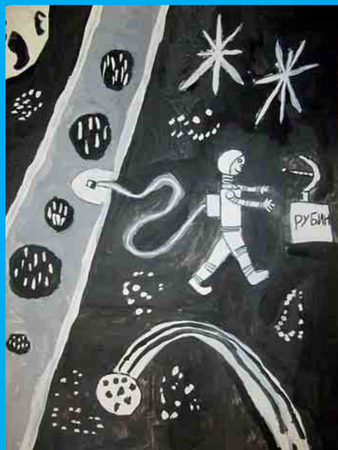
Лайков Антон, 10 лет «Человек в космосе»