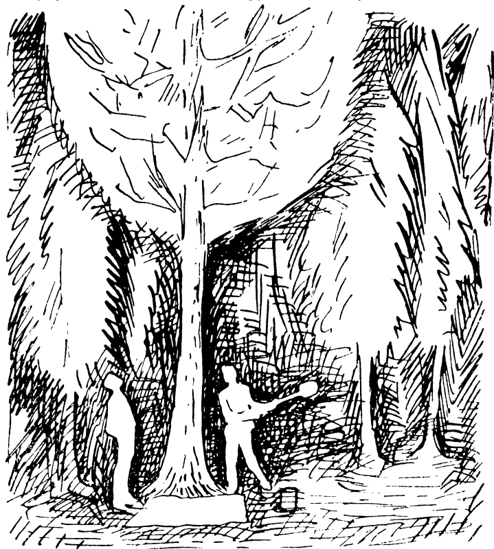
Рисунки Б. ДОЛЯ

Ромадин нес за плечами легкий рюкзачок, в котором были лупа, нож, совок, морилка — банка с отравой и фильтровальной бумагой, свернутая простыня. В одной руке он держал — сам этому удивляясь — сачок; в другой маленькую лопату. Зотов