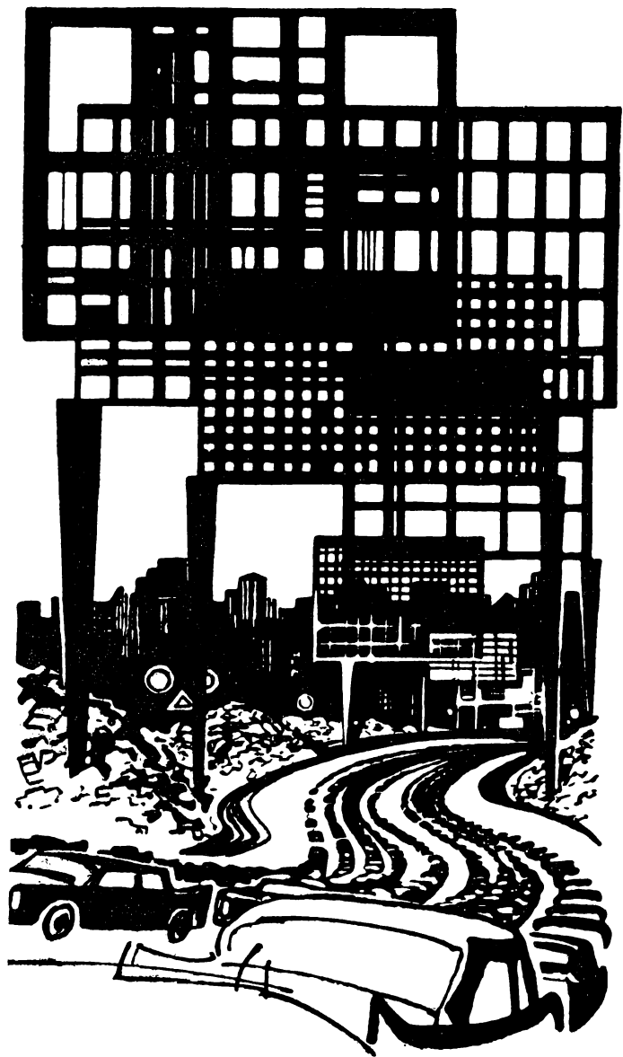
Рисунки Н. ГРИШИНА