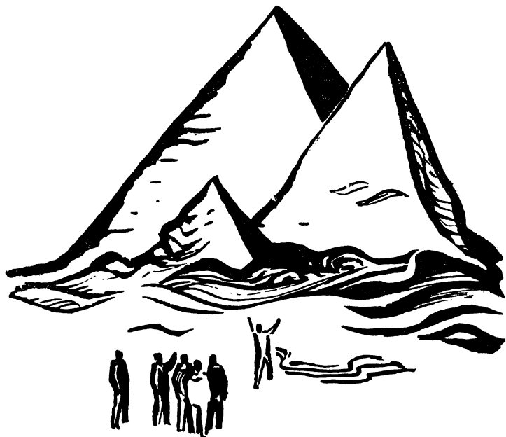
Рисунки Н. ГРИШИНА

На исследуемой же планете не возникло подобной формы защиты, поэтому-то одно-единственное существо и овладело всей планетой, покрыв со временем своим телом всю ее поверхность. В его распоряжении было все живое планеты, вся ее влага, все, что ему только требовалось. Оно было вполне удовлетворено. А поскольку ему никогда не приходилось сталкиваться с противником, наделенным сознанием, оно и не развило в себе сопротивляемости — своеобразного защитного экрана — против постороннего внушения. И оказалось, таким образом, бессильным против собственного же оружия.