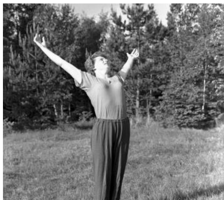
Утренняя зарядка - обязанность каждого советского космонавта!