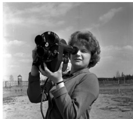
... а также кинематограф... Фотографии 1960-ого года, сделанные после полета

вместо нее все испытания выдержала Валентина Терешкова, на счету которой было 90 прыжков. В марте 1962 года был сформирован женский космический отряд, старшей в котором назначили Валентину; всех его участниц приняли в партию и дали воинские звания рядовых. Режим тренировок для девушек – термокамера, сурдокамера, режим невесомости, прыжки с парашютом на воду, в технологическом скафандре и другое – был даже более жестким, чем для мужчин. Терешкова прошла все испытания на самую высокую оценку. Первоначальная программа предусматривала одновременный запуск двух женщин-космонавтов, однако впоследствии решили ограничиться одним кораблем, пилотируемым женщиной. Уже ни для кого не