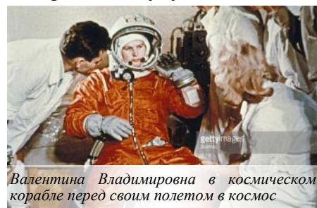
Валентина Владимировна в космическом корабле перед своим полетом в космос

Итак, Первым человеком, ступившим на Луну, стал Нил Армстронг. Это произошло 21 июля, в 02:56:15 UTC. Через 15 минут к нему присоединился Элвин Олдрин, а позже Майкл Коллинз. Экипаж стал первым, покоривший Луну.