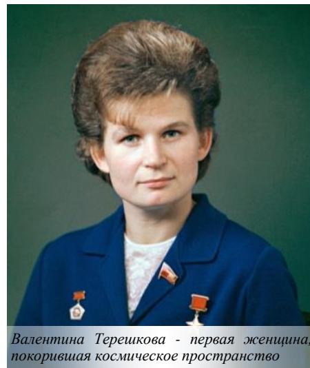
Валентина Терешкова - первая женщина, покорившая космическое пространство