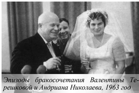
Эпизоды бракосочетания Валентины Терешковой и Андриана Николаева, 1963 год