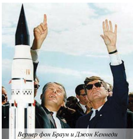
Вернер фон Браун и Джон Кеннеди