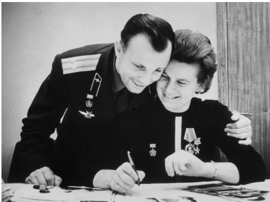
Имена Юрия Гагарина и Валентины Терешковой золотыми буквами вписаны в историю освоения космоса... 1960-е годы

Господство в космосе позволяло обеспечить военное превосходство над противником: помимо размещения на околоземной орбите средств слежения - спутников-шпионов, - вывод в космос ядерного оружия позволил бы беспрепятственно нанести удары по врагу. О такой возможности думали и американские, и советские военные, приступая к освоению околоземного пространства.