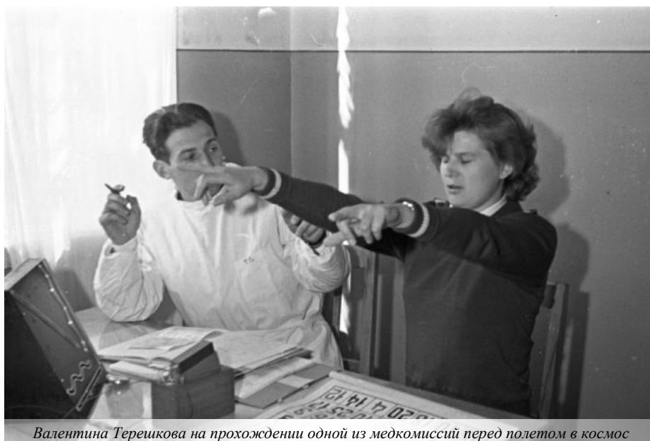
Валентина Терешкова на прохождении одной из медкомиссий перед полетом в космос

Девушки, отобранные для космического полета, надеялись, что все они рано или поздно