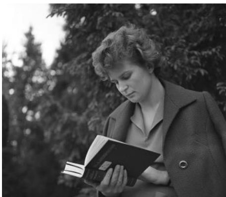
Валентину Терешкову в жизни интересовало не только небо, но и: литература...