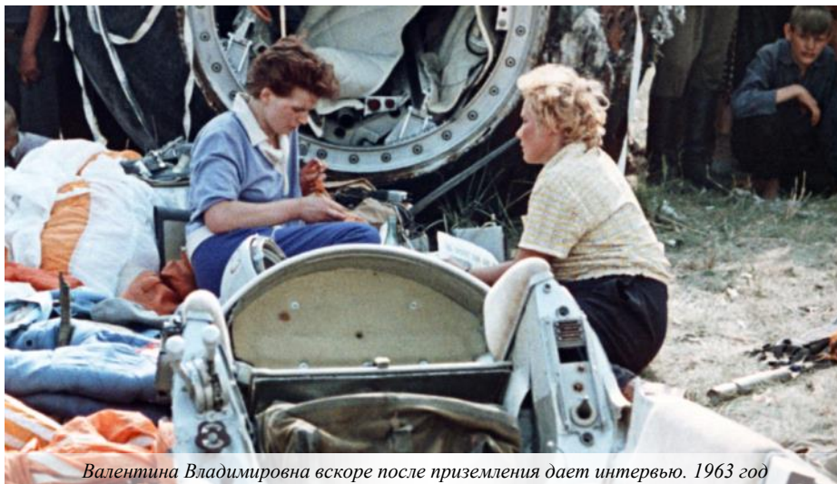
Валентина Владимировна вскоре после приземления дает интервью. 1963 год