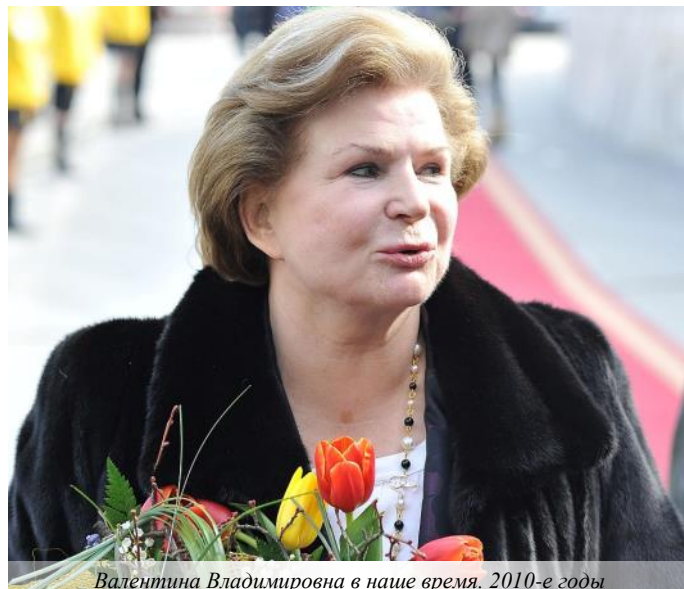
Валентина Владимировна в наше время. 2010-е годы

Терешкова часто встречается с земляками. Идут к ней в основном с жалобами, просьбами, знают, что поможет. Во время предвыборной кампании, когда люди часто выкладывают свои обиды на власть, кандидату в депутаты Госдумы от Ярославской области Терешковой из зала вдруг задали вопрос: «А вам сейчас не стыдно носить звание Героя Советского Союза?» Она поднялась и сказала: «Нет, не стыдно, потому что я всю свою жизнь верой и правдой служу Отчеству и моему народу. И в том числе вам. Мне вас жаль». Потом спрашивающий подошел и стал оправдываться: мол, его не так поняли. «Я не хочу это комментировать, - говорит Терешкова. - Я знаю, что моя жизнь действительно принадлежит людям».