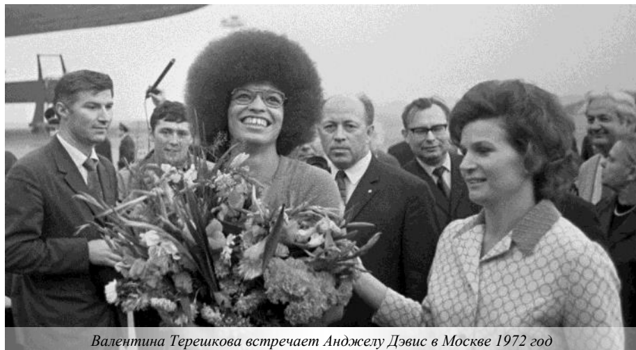
Валентина Терешкова встречает Анджелу Дэвис в Москве 1972 год

Терешкова действительно не видела границ. Ее комитет призывал женщин всех госу-