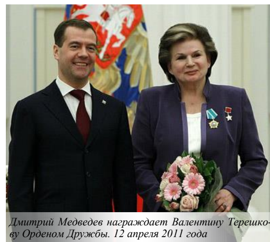
Дмитрий Медведев награждает Валентину Терешкову Орденом Дружбы. 12 апреля 2011 года

Что ж! Духом она по-прежнему молода. И в одном из последних интервью на вопрос - хотелось ли бы ей вновь отправиться в космос, Терешкова ответила: «Не задумываясь. Мне снится полет!»