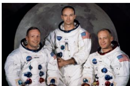
Официальный портрет экипажа «Аполлон-11»: Н. Армстронг, М. Коллинз и Э. Олдрин

Господство в космосе позволяло обеспечить военное превосходство над противником: помимо размещения на околоземной орбите средств слежения - спутников-шпионов, - вывод в космос ядерного оружия позволил бы беспрепятственно нанести удары по врагу. О такой возможности думали и американские, и советские военные, приступая к освоению околоземного пространства.