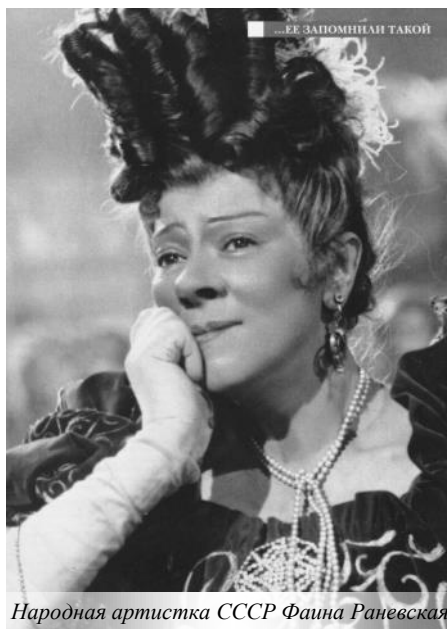
Народная артистка СССР Фаина Раневская

совет остролова, который объяснял всем, как почувствовать себя пилотом корабля серии «Восток». Что для этого нужно сделать? Надеть куртку-пуховик, меховую шапку, валенки, забраться в кресло и с медицинской уткой в штанах просидеть так 2-3 дня. Вставать нельзя, опорожнять утку тоже нельзя. При этом нужно вести дневник, фотографировать окрестности и докладывать по связи: «Полет проходит нормально, чувствую себя отлично».