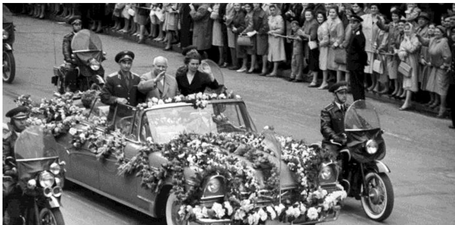
Москва. 1-й секретарь ЦК КПСС Никита Хрущев (в центре) и космонавты Валерий Быковский и Валентина Терешкова. 1963 год

Но все это было полным бредом, потому что пилоты «Востоков» катапультировались из своих спускаемых аппаратов в специальных креслах на высоте 7 километров. Терешкова отстегнулась от кресла на высоте 4 километра и приземлялась уже на парашюте. Другая версия приземления была тщательно отредактирована: под прицелом кинокамер Валя пьет молоко, за процессом наблюдают сотни зрителей. Но это так называемая реконструкция, ее снимали на следующий день после приземления.