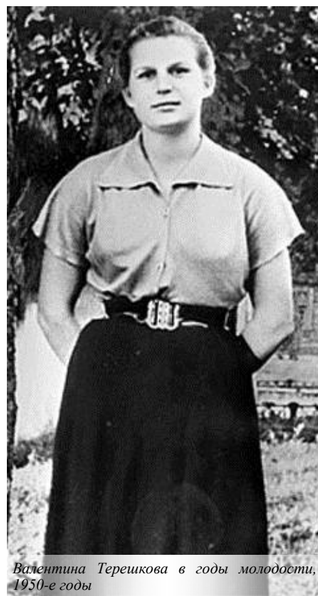
Валентина Терешкова в годы молодости, 1950-е годы

нимать. Еще в детстве, чтобы проверить себя, она прыгнула в реку с высоченного ярославского моста.