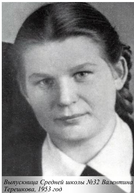
Выпускница Средней школы №32 Валентина Терешкова, 1953 год