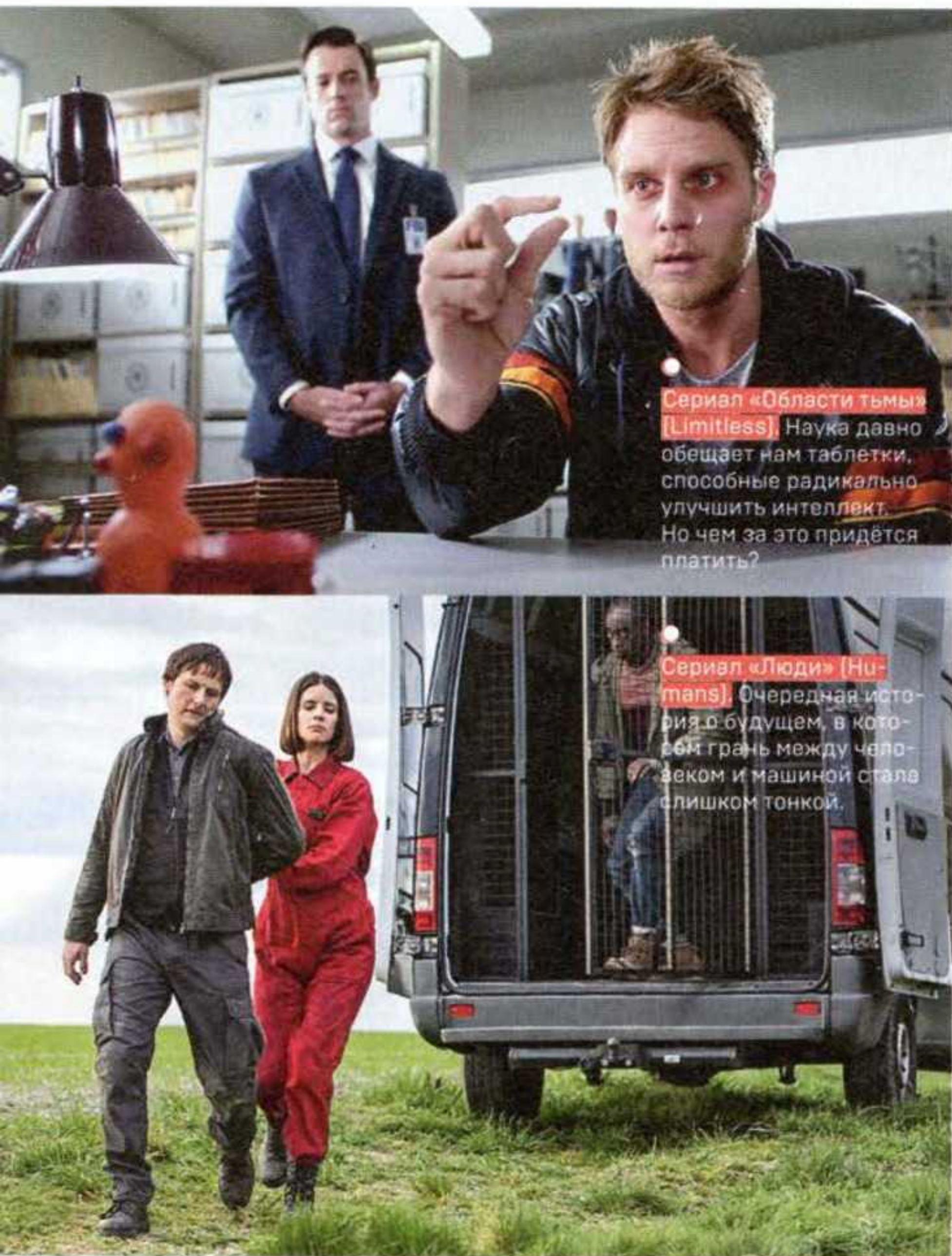
Сериял «Области тьмы» [Limitless] Наука давно обещает нам таблетки, способные радикально улучшить интеллект. Но чем за это придётся платить?