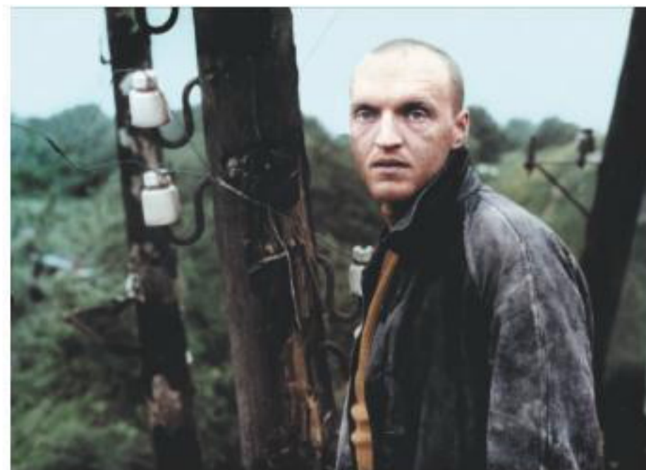
■ Кайдановский последовательно сыграл двух персонажей: сперва крутого парня Алана, а потом — безымянного юродивого сталкера. К сожалению, первого мы никогда не увидим

Но в самой книге антураж не главное. «Пикник на обочине» — рассказ о жизни человека, попавшего в «зону притяжения» этого удивительного места.