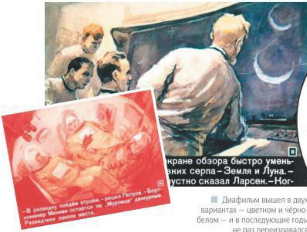
■ В раннем варианте картины «Муромец» — в разведку пойдём стройки — решил Петров. — Борщ-интерьер Мухомов остался на «Муромца» — да и Муромца Развадкина звали Мухомов.

■ Диафильм вышел в двух вариантах — цветном и чёрно-белом — и в последующие годы не раз переиздавался