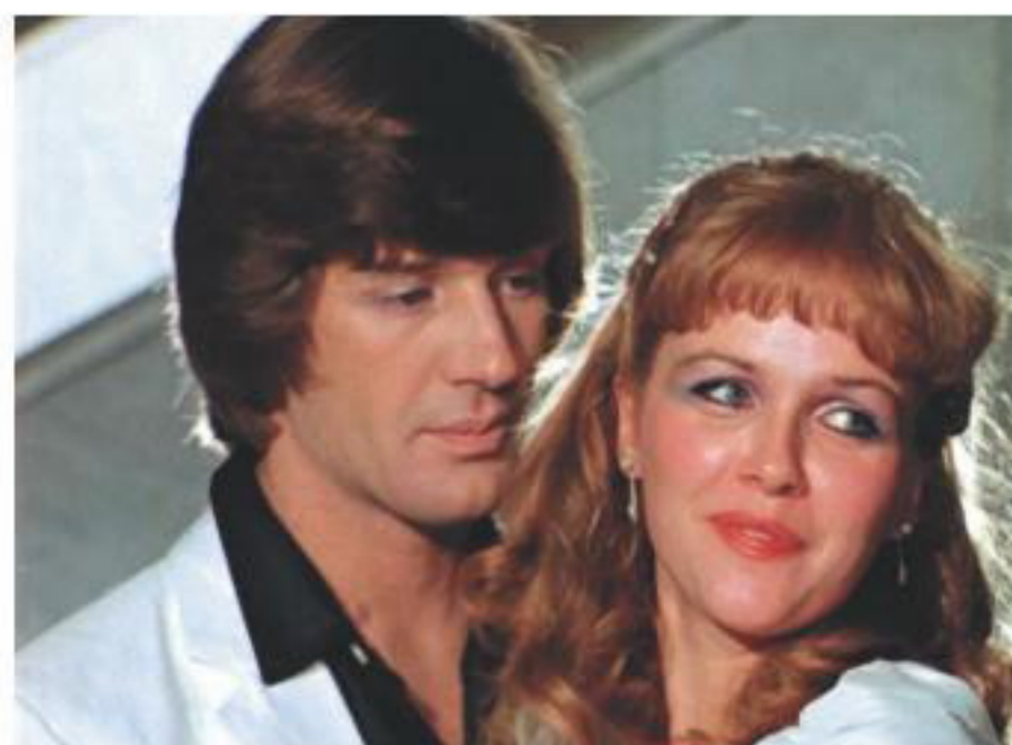
■ В центре новогоднего мюзикла, разумеется, любовная история