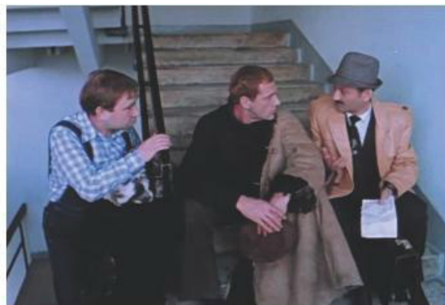
■ Главная изюминка «Чародеев» — блестящий актёрский ансамбль

На советском телевидении новогодние мюзиклы представляли собой практически отдельный жанр. В них всегда собирали лучших актёров,