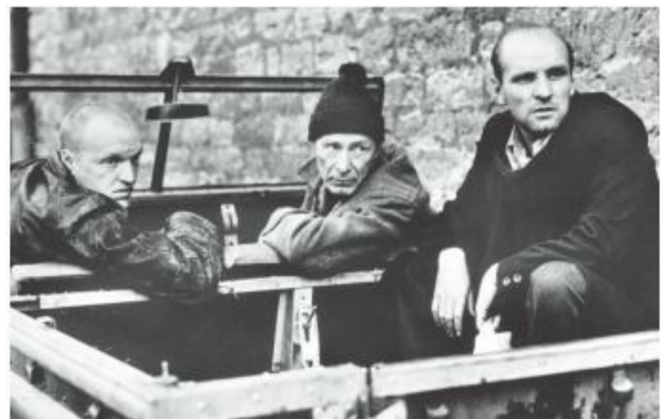
■ Герои фильма больше всего напоминают троицу запойных алкоголиков