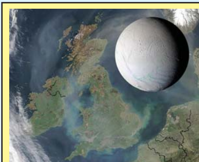
Сравнение Энцелада с Британией. Загадочная луна Сатурна имеет диаметр 505 километров. «Полосы тигра» видны внизу