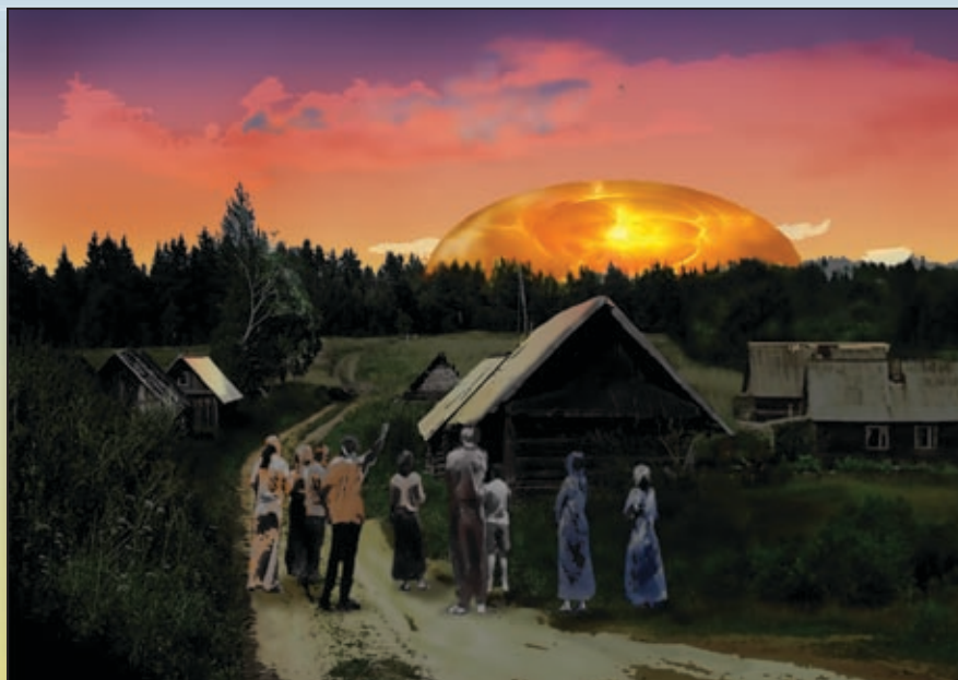
Огненная полусфера, наблюдавшаяся в Малышевске (по рисунку Н. Керножицкого)

Анатолия догнала немецкая легковая машина — нежелательная встреча в ночное время, — и он юркнул в кукурузу на обочине. Машина, пройдя метров триста, остановилась, захлопали дверцы. Видимо, седоки вылезли проветриться. Отчетливо была слышна немецкая речь.