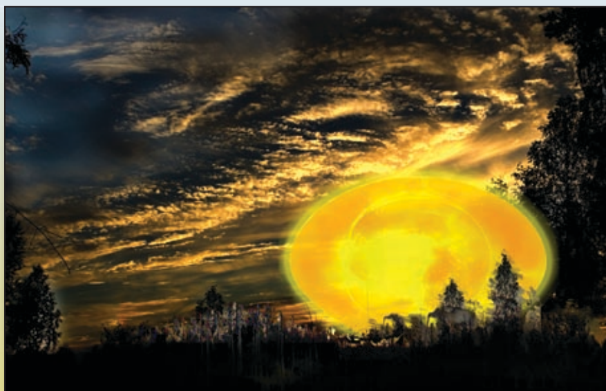
Первый сфероид на стадии максимального развития (по рисунку А. Клименко)

Свечение несколько секунд мерцало и колебалось, а потом вдруг быстро начало расти, принимая форму четко очерченного светящегося огненного пузыря, который за 10-20 секунд увеличился до грандиозных размеров, многократно превзойдя размеры солнечного диска на закате. Резкие, четкие, идеально-геометрические