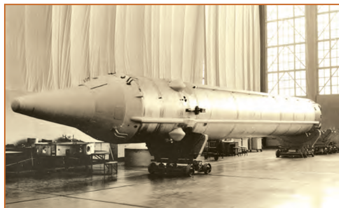
УР-100 в цехе предприятия