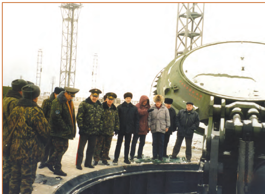
Комиссия по продлению сроков эксплуатации комплекса УР-100Н УТТХ возле шахтно-пусковой установки на космодроме Байконур

Было принято к сведению заявление В. Н. Челомея о том, что результаты пуска ракеты УР-100Н УТТХ 19 июля 1981 г. положительные (точность попадания боевых блоков, уровень виброперегрузок, углы отклонения гиросинтезаторов и др.). Госкомиссия поддерживает выводы ЦКБМ. Рекомендовали Госкомиссии следующий пуск провести с теми же доработками.