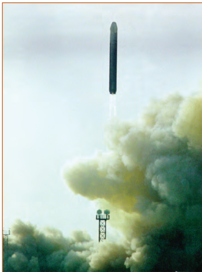
Пуск МБР УР-100Н УТТХ

Ракеты УР-100К размещались в шахтных пусковых установках (ШПУ) ракет УР-100. В ракете УР-100К были