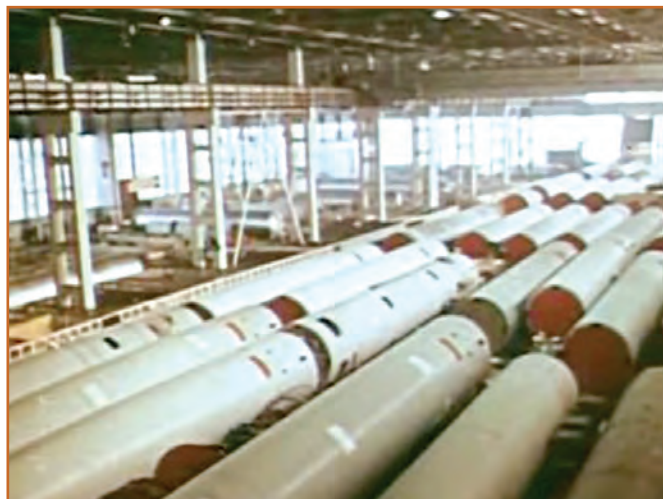
МБР УР-100 на заводе им. М. В. Хруничева

Аналогичное письмо В. Н. Челомей направил Министру общего машиностроения С. А. Афанасьеву и Министру обороны СССР маршалу Советского Союза А. А. Гречко. Однако дублирование продолжалось.