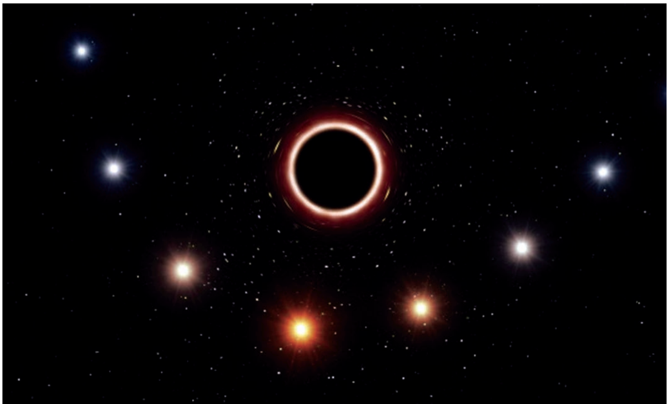
Подтверждение теории относительности Эйнштейна

Поиск удовлетворительного синтеза общей теории относительности и квантовой теории (квантовой теории гравитации) — активная область исследований, находящаяся на передовом рубеже современной физики. Это не только поиск новой теории. Это поиск новых принципов, новой философии, новой реальности.