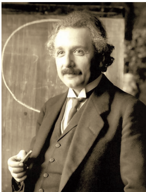
Альберт Эйнштейн (1879–1955) во время чтения лекции (Вена, 1921 г.).

Ученые теоретически вычислили и измерили на опыте сдвиг в спектре излучения звезды S2, в который вносят вклад релятивистский поперечный эффект Доплера, предсказываемый специальной теорией относительности, и эффект гравитационного красного смещения, предсказываемый общей теорией относительности.