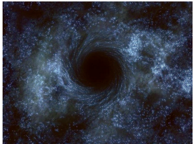
Черная дыра в представлении художника.

Так же, как и теория относительности, квантовая теория, первоначально созданная для описания поведения микрочастиц, является фундаментальной теорией. Описываемая ею квантовая реальность отличается от классической. Бессмысленно, например, говорить о траектории или одновременных значениях скорости и положения элементарной частицы. Квантовые частицы могут как бы одновременно находиться в разных состояниях, например в разных точках пространства. Их состояния