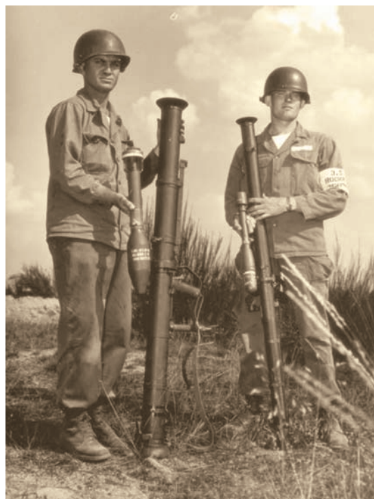
Старое и новое: Реактивные противотанковые гранатометы М20 с гранатой М28 (слева) и М9А1 с гранатой М6А3 (справа)

Ввиду изменения контактного устройства в гранатометах М28А1 и М28В1А1 были созданы модифицированные соответствующим образом гранаты — боевая М28А2 и учебная М29А2. Ими можно было стрелять и из старых гранатометов, но для новых модификаций «супербазуки» гранаты прежних типов не годились.