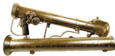
РПГ М20А1В1. Слева — в боевом положении, справа — в разобранном