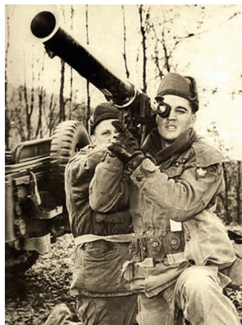
Наиболее известный стрелок из «супербазуки» — Элвис Пресли во время его срочной службы в армии США