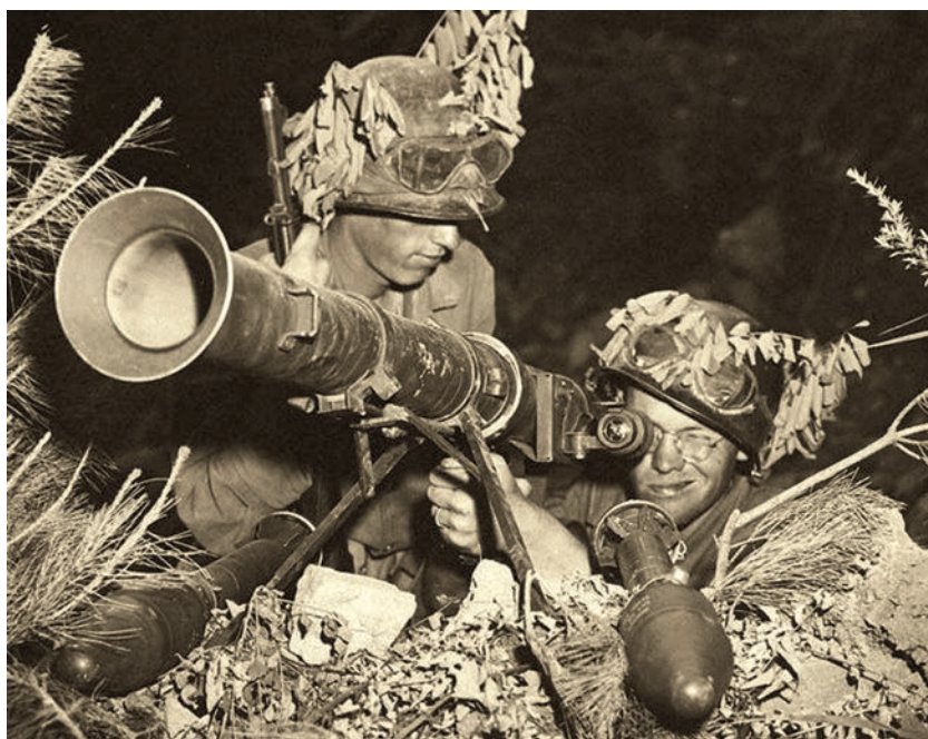
Расчет «супербазуки» на огневой позиции

Для полноты картины упомянем еще эксперименты с установкой «супербазук» на вертолеты. В 1950 г. армия США испытывала установку гранатометов М20 на легком вертолете Н-13Д, а годом позже Корпус морской пехоты проводил опыты с аналогичными вооружением вертолета НТЛ-4 в эскадрилье НМХ-1 (оба вертолета — Н-13Д и НТЛ-4 — были