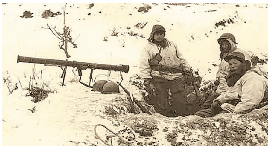
На позиции где-то в Корее. Наличие дугоги и дополнительной винтовой опоры позволяло надежно фиксировать гранатомет на огневой позиции

Выпуск РПГ М20 и М20В1 начался в 1948 г., но два года спустя они имелись на вооружении лишь нескольких частей на территории США и Западной Германии. Согласно тогдашним штатам, М20 (М20В1) предусматрива-