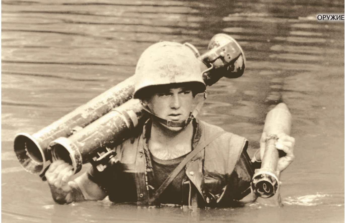
Американский морской пехотинец с «супербазукой», переправляется через водную преграду во Вьетнаме. Октябрь 1966 г.