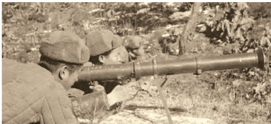
Китайские «добровольцы» с трофейной «супербазукой»

вариациями модели «Белл» 47D). Однако в дальнейшем для вооружения вертолетов выбрали более подходящее оружие — неуправляемые ракеты, а затем и ПТУР.