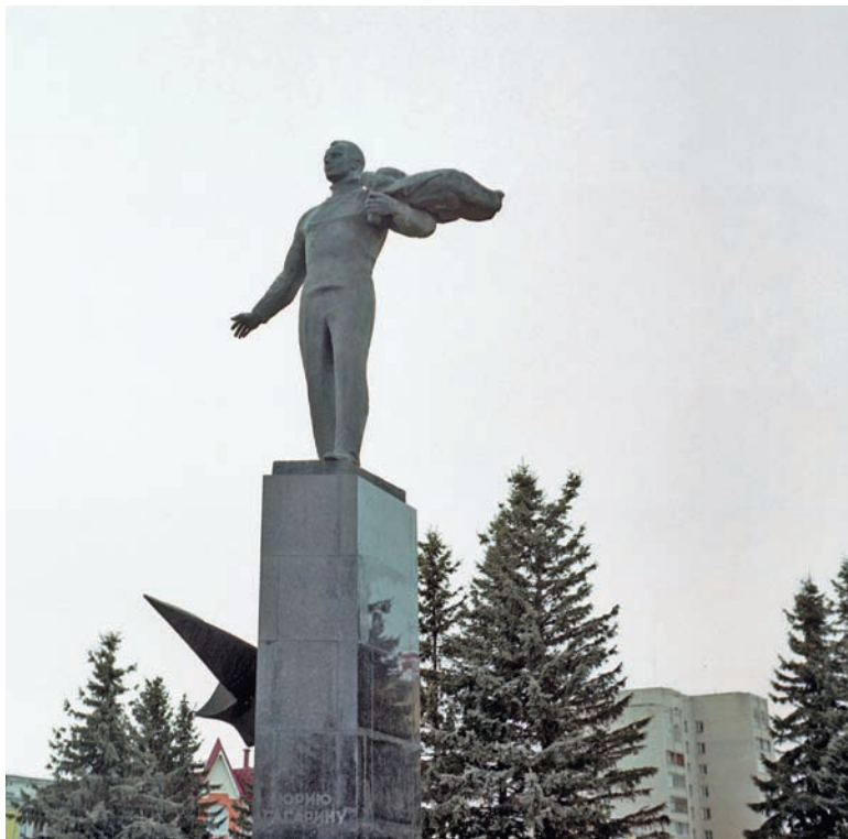
Памятник Гагарину стоит перед гостиницей «Восток» и рестораном «Восток»