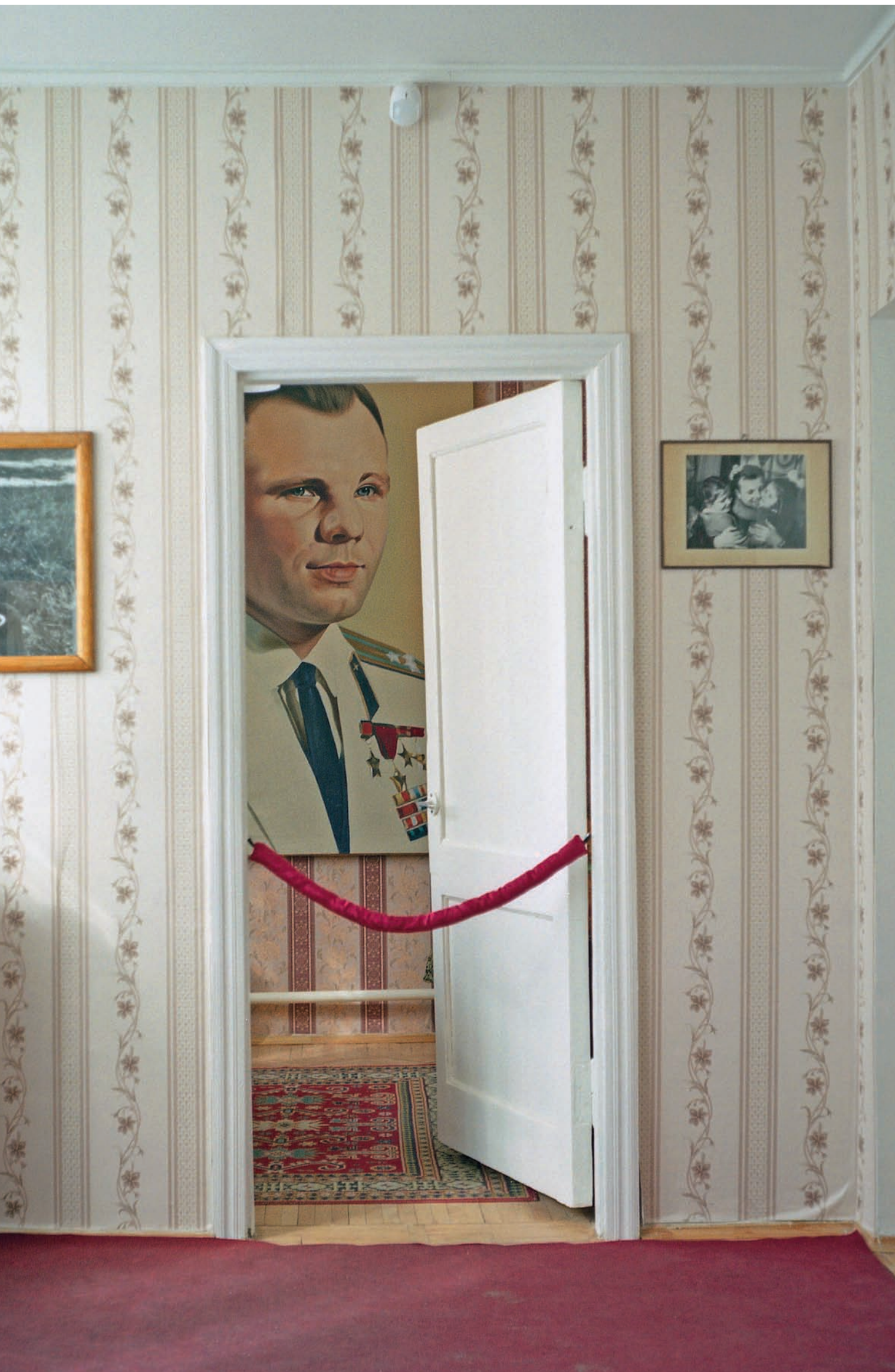
Наталья Радулова, Гагарин — Москва

Н ебольшой город Гагарин, бывший Гжатск, — родина первого космонавта. Пожалуй, это единственный населенный пункт в мире, где так много на улицах изображений одного человека.