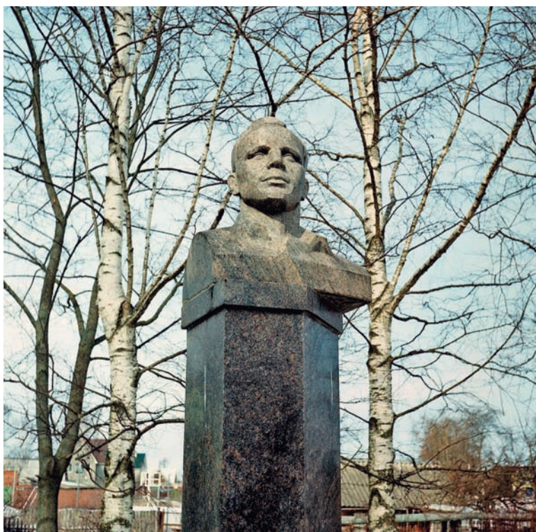
Бюст первопроходца космоса