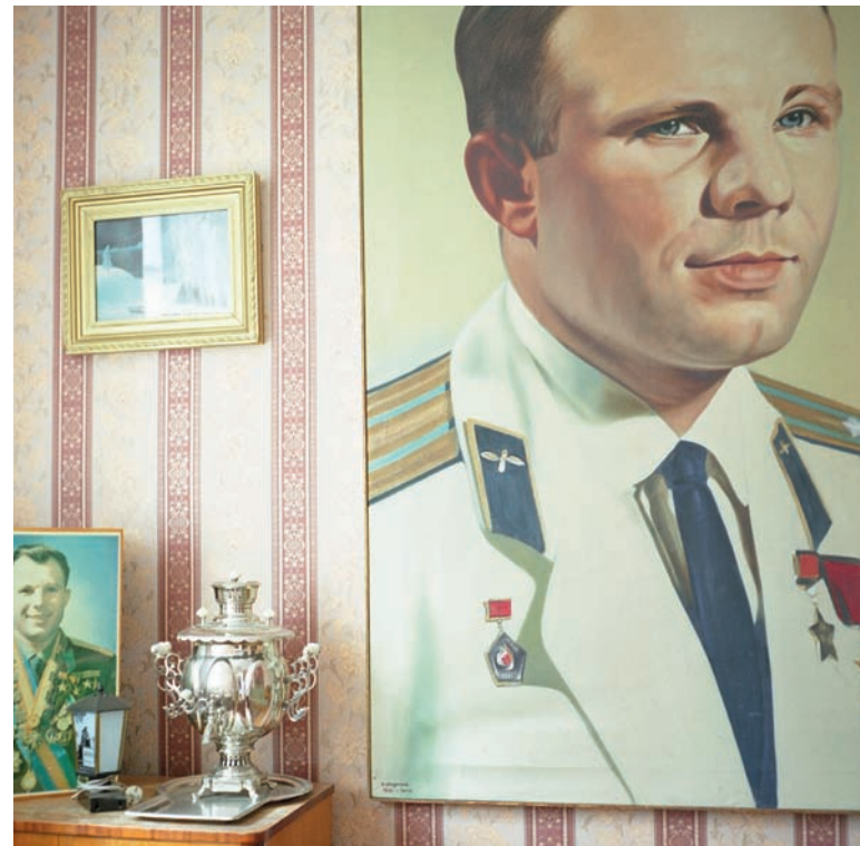
В семье Гагариных было четверо детей. Но стены в родительском доме увешаны портретами одного

СЛОВО О СЫНЕ Одно только перечисление памятных мест города займет нема-