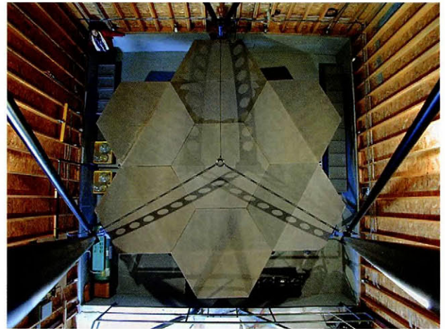
ЗЕРКАЛО ТЕЛЕСКОПА LZT представляет собой пластиковую чашу из семи шестиугольных и шести треугольных сегментов. Сегментам с помощью термоформовки придается форма параболоида вращения, чтобы минимизировать толщину слоя ртути готового зеркала.