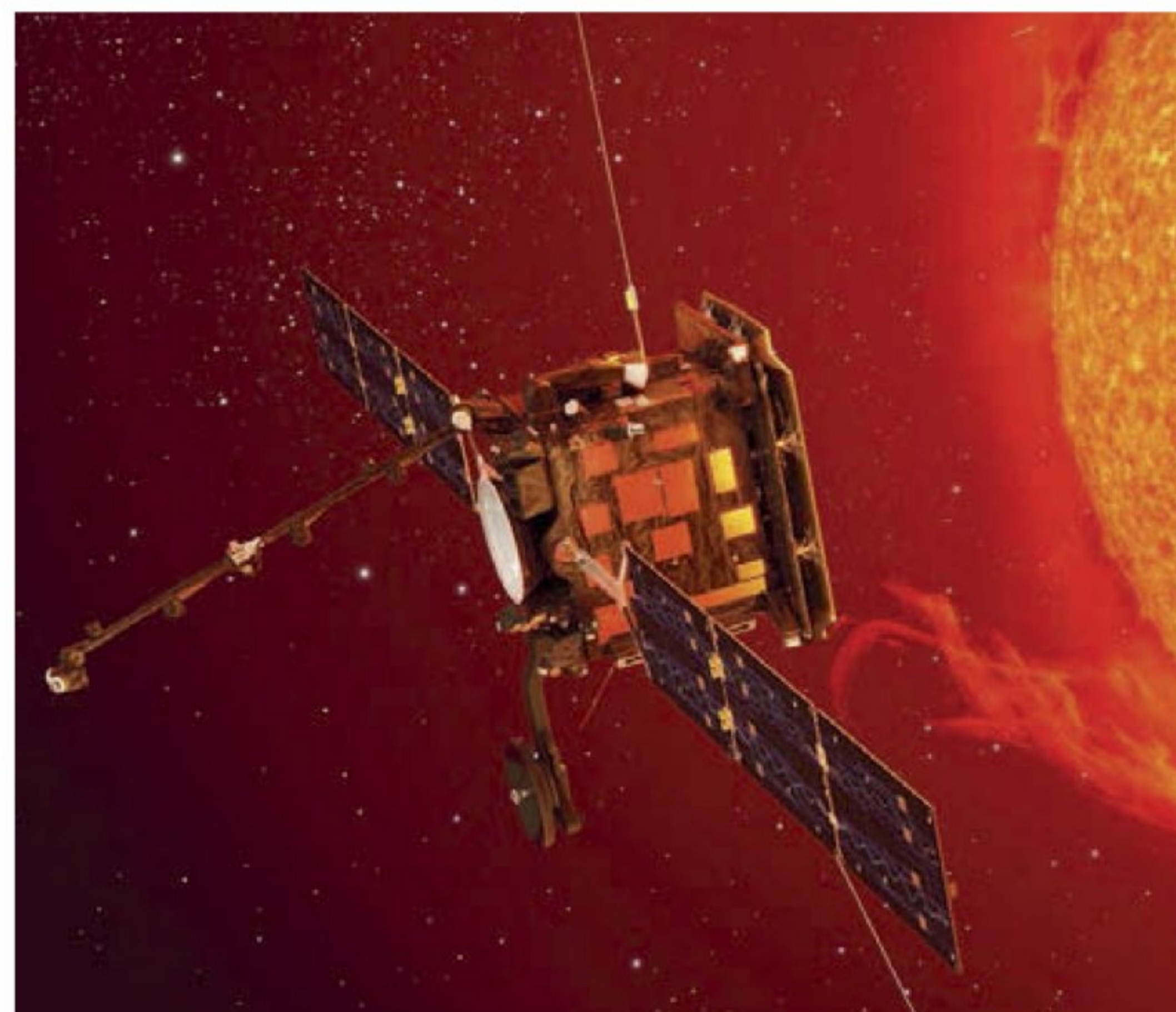
Космический аппарат Aditya, предназначенный для исследования Солнца, планируется запустить в первой половине 2020 года

Локальная неудача, разумеется, не остановит планов ISRO, главные из которых связаны с развитием пилотируемой программы. Уже готов космический корабль Gaganyaan, рассчитанный на экипаж из трех человек. Летом 2018 года он прошел бросковые испытания, и предполагается, что его первый полет состоится