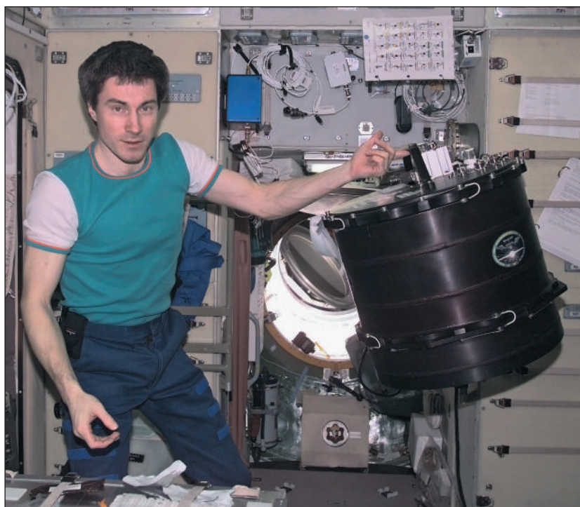
Летчик-космонавт С.К.Крикалёв во время эксперимента «Плазменный кристалл» на Международной космической станции.