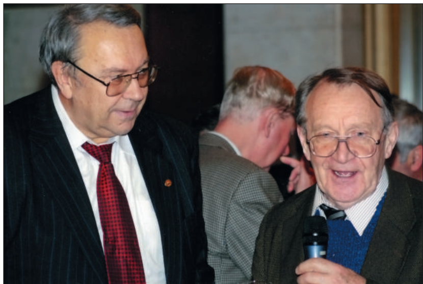
С академиком Р.З.Сагдеевым.