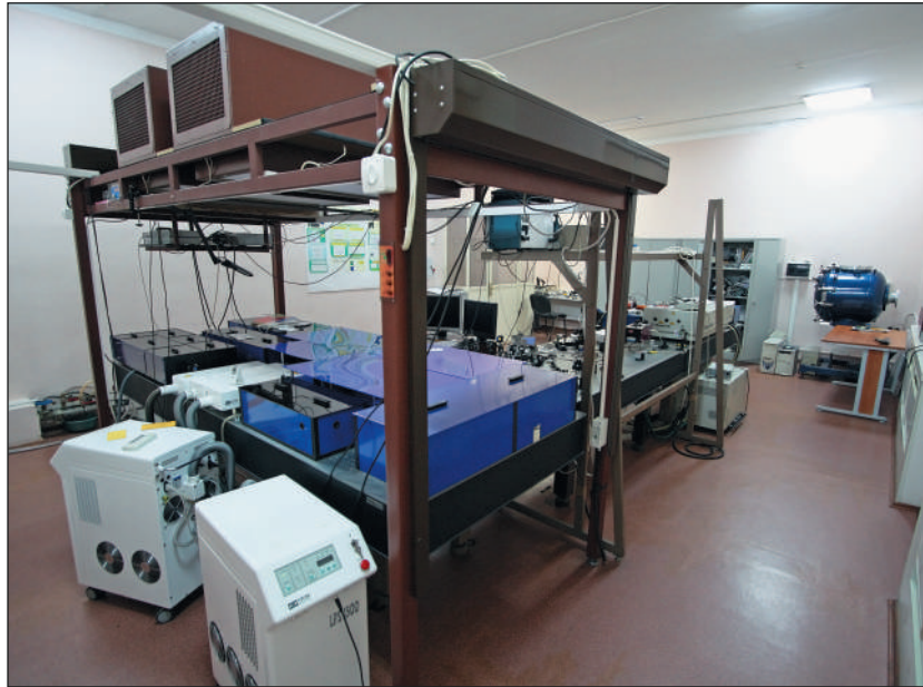
Фемтосекундная тераваттная лазерная система инфракрасного диапазона излучения на основе активного элемента хром-форстерит, созданная в 2002 г. в ОИВТ РАН.

Проект «Вега» занял около 15 лет (от конца 1970-х до начала 1990-х годов) моей научной жизни. Поэтому я мог в деталях видеть работу тандема Фортова и Анисимова на этом отрезке времени. Начиналось все с оценок и анализа метеоритных теорий. Простейшие подходы были тогда именно оценками, так как они на порядки завывшали, как выяснилось в результате исследований, температуру и выброшенную массу. Например, если при скорости 80 км/с (скорость частицы пылевой кометы относительно аппарата) кинетическая