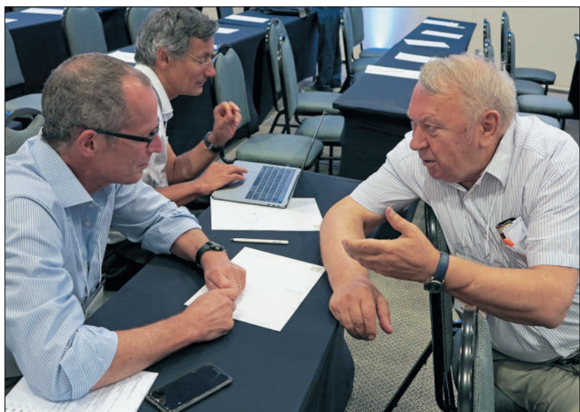
Научный спор. На конференции по физике плазмы в Рио-де-Жанейро, Бразилия. 6 августа 2019 г. Публикуется впервые.