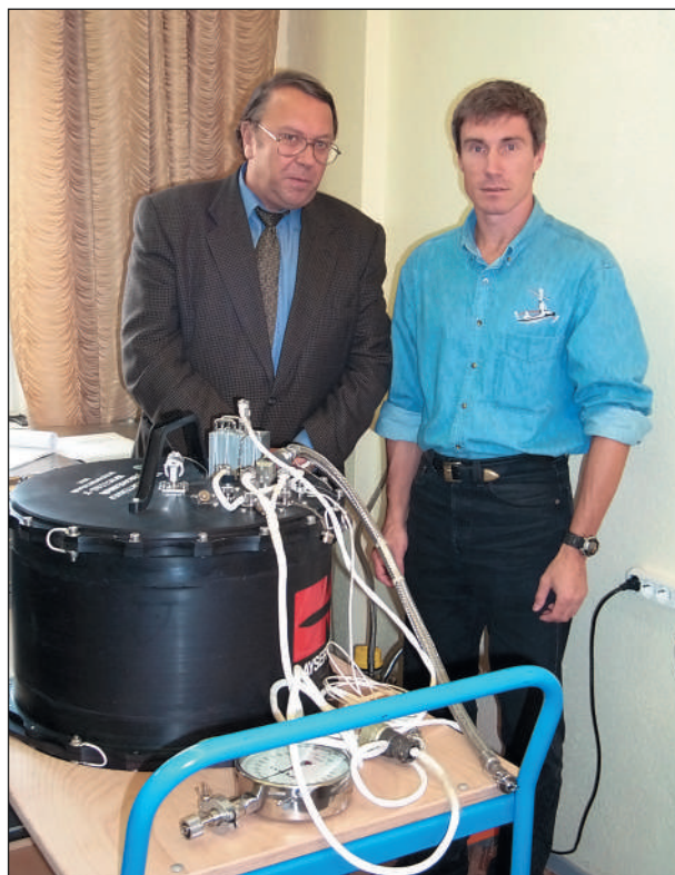
С летчиком-космонавтом С.К.Крикалёвым и установкой «Плазменный кристалл». 2000 г.

Я также очень люблю цикл работ Фортова по созданию плазменно-пылевых кристаллов в условиях микрогравитации на Международной космической станции (МКС). Были выбраны почти оптимальные условия для проверки моделей самоорганизации неидеальной (плотной) пылевой плазмы. Установка «Плазменный кристалл» постоянно усовершенствовалась и проработала на борту МКС много лет. Космонавтам нравился этот эксперимент, и они с удовольствием им занимались. Помню, как Владимир Евгеньевич благодарил Сергея Крикалёва — лет-