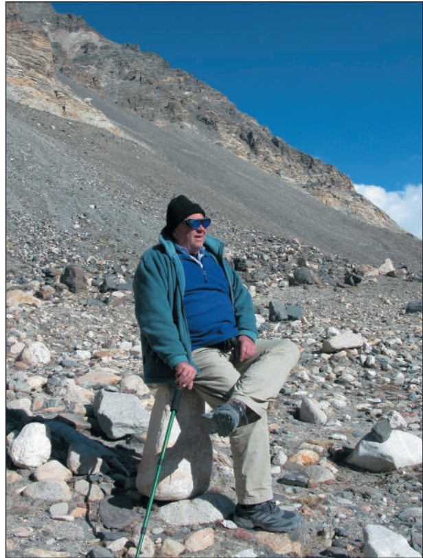
Горы Тибета заставляют переоценивать привычные масштабы. В базовом лагере на Эвересте. 12 апреля 2009 г.