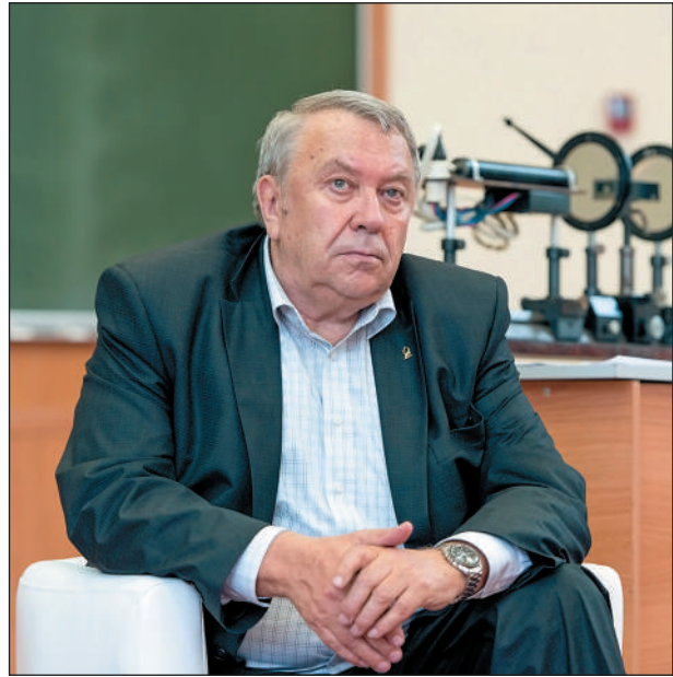
В alma mater — на Физтехе. 2013 г.

Фортов — член ряда иностранных академий наук и научных сообществ, лауреат многих престиж-