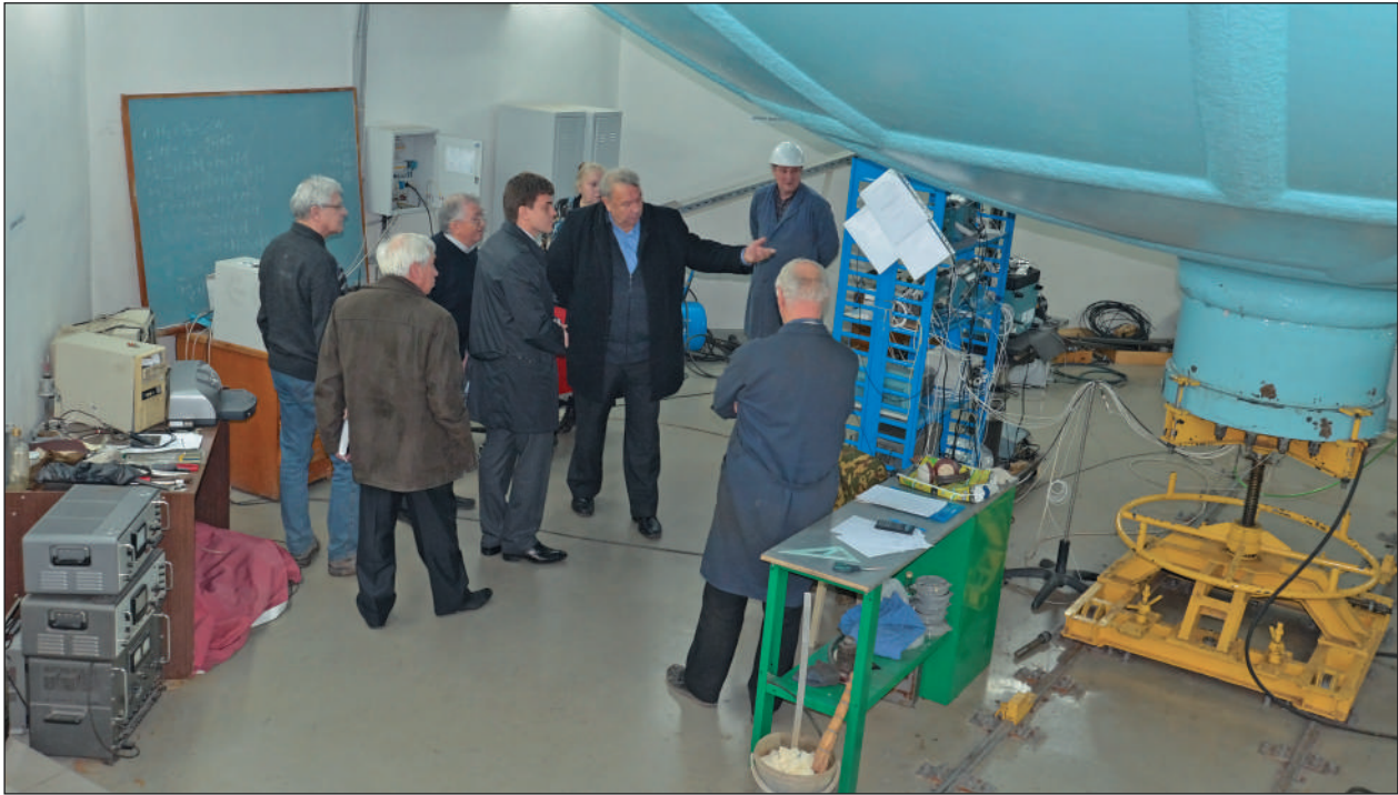
В Московском региональном взрывном центре коллективного пользования в ОИВТ РАН.

вича был проведен цикл пионерных работ по изучению плазменных кристаллов и жидкостей в пылевой плазме в лабораторных условиях с применением новейших методов их генерации и диагно-