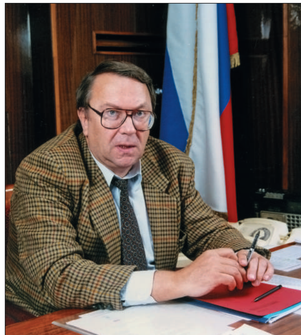
Во время работы в правительстве.