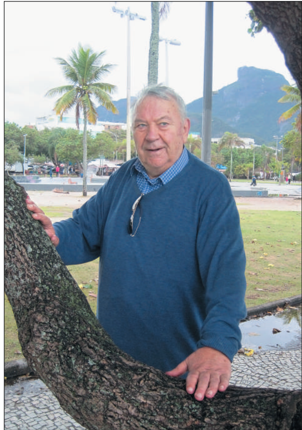
Прогулка по Рио-де-Жанейро, Бразилия. 4 августа 2019 г. Публикуется впервые.