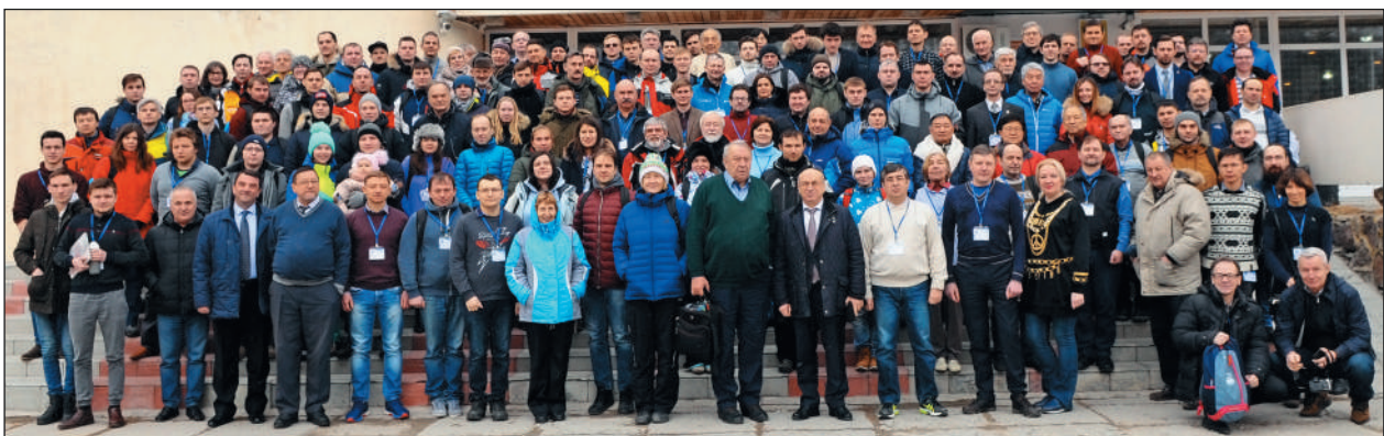
На 33-й международной конференции на Эльбрусе «Уравнения состояния вещества». 2018 г.

Последний раз Владимир Евгеньевич сильно поддержал нас, физиков КБГУ, когда возникла реальная угроза потери магистратуры по физике в нашем университете. Он написал в Президиум РАН: «Настоящим письмом я понимаю поддерживаю наших кабардино-балкарских коллег и надеюсь, что это поможет нашему общему делу». Это было 18 августа 2020 г. ■