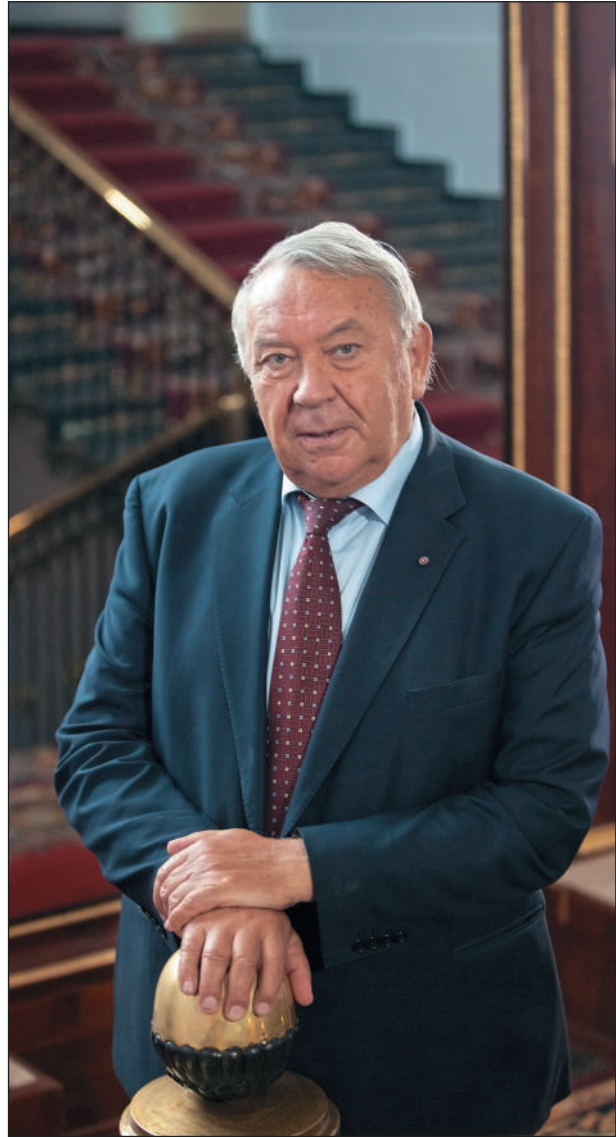
В здании Президиума РАН.