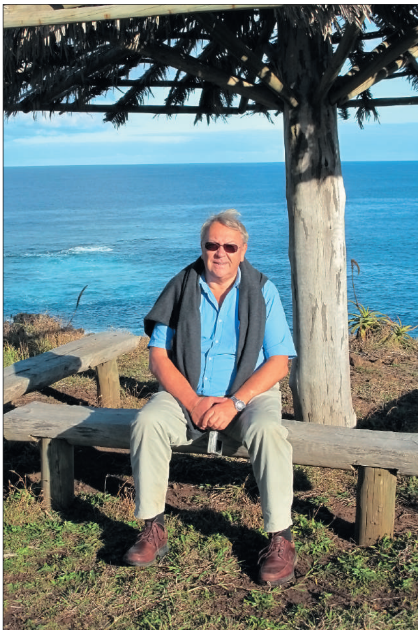
Вдали от всех проблем. На острове Пасхи. 8 августа 2010 г. Публикуется впервые.