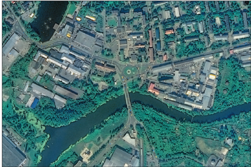
Фотопанорама г.Ногинска из космоса, со спутника «Метеор-М».

Я знал, что он болел. Но мы надеялись, что Володя, будучи спортсменом, человеком с сильным