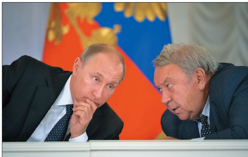
С Президентом РФ В.В.Путиным. 8 октября 2014 г.

Было заметно, как сильно переживал Владимир Евгеньевич эти события, откровенно говоря, заставшие его врасплох. Многие его коллеги предлагали просто отказаться от членства в этой искалеченной «реформаторами» Академии. Сам Фортов — крупнейший, известный во всем мире ученый — не будь он месяц назад выбран президентом РАН, возможно, так бы и поступил, причем одним из первых. Но на его плечах уже лежала забота о других — тысячах членах Академии наук, которые при таком исходе событий потеряли бы и дело