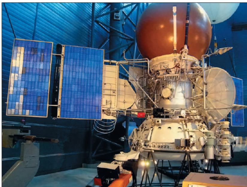
Космический аппарат «Вега» для исследования кометы Галлея.

рах президента РАН, которые должны были состояться весной. По-моему, Владимир Евгеньевич сомневался, стоит ли ему второй раз втягиваться в этот процесс. Ему, думаю, тогда было интересно мнение «простого» академика, далекого от академического истеблишмента. Я, наоборот, не сомневался в целесообразности такого шага — помнил его программу еще с прошлых, «невыйгранных», выборов — и принялся уговаривать его вновь «войти в эту реку». Где были «Вольфы Мессинги», умеющие предсказывать будущее — трагедию июня 2013 года? И особенно тяжело давшуюся ему, на мой взгляд, оскорбительную инсценировку снятия кандидатур с выборов в 2017 г. Уверен, что годы прези-