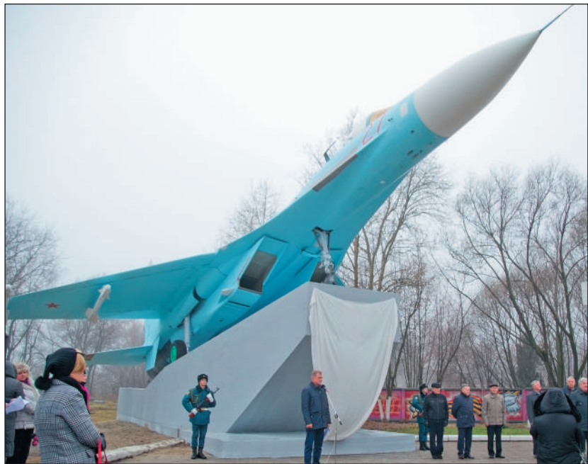
Боевой самолет Су-27, подаренный В.Е.Фортовым г.Ногинску в год 70-летия Победы в Великой Отечественной войне.

характером, выкарабкается. К сожалению, не получилось. Нам всем будет его очень не хватать — замечательного, яркого, красивого, талантливого. Мы будем помнить его, вспоминать его улыбку, перечитывать книги и статьи, но, конечно, его живого присутствия в нашей жизни ничто и никто никогда не заменит.