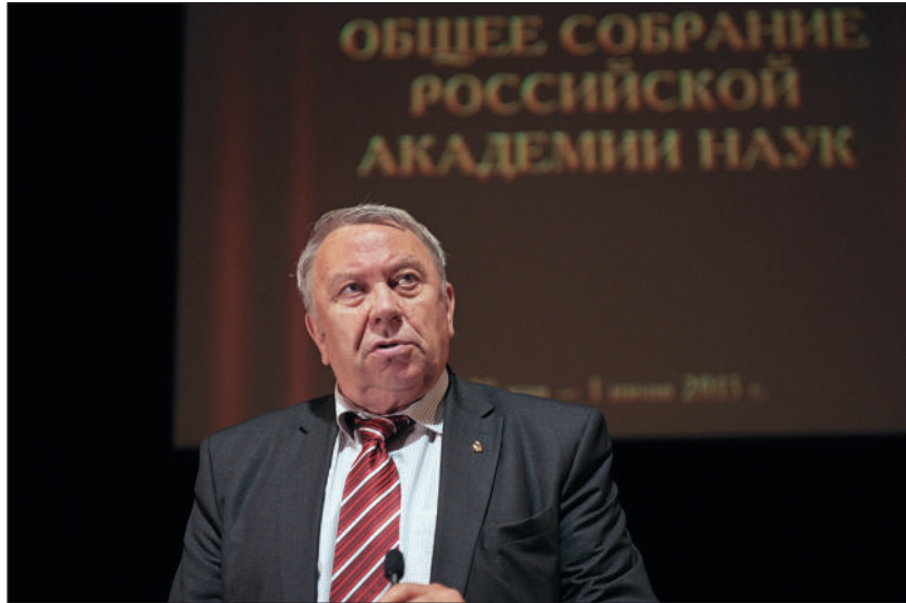
Президент РАН. 28 Мая 2013 г.

Но надежды не сбылись. Новому президенту не дали возможности осуществить в РАН эти кардинальные, но одновременно и бережные преобразования, которые позволили бы сохранить ее стиль и традиции. Если можно так сказать, ее научную душу. В конце июня последовала атака на Академию. Благодаря В.Е.Фортову, Е.М.Прима-