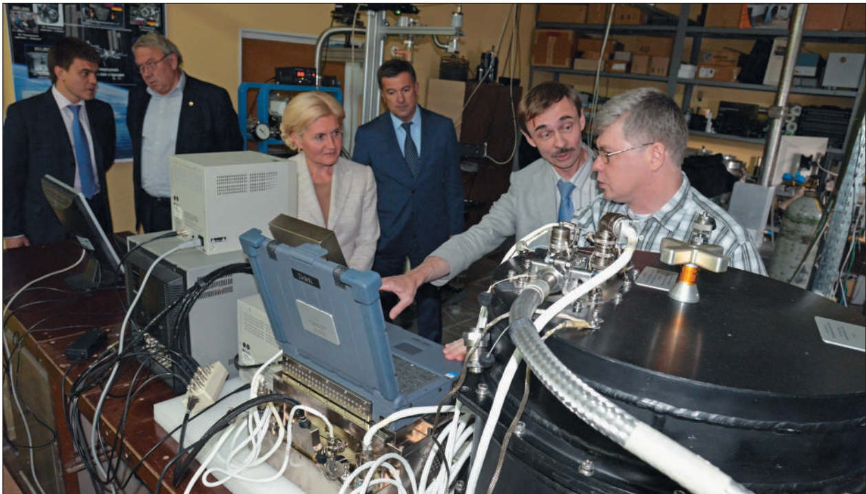
В лабораторном комплексе установки «Плазменный кристалл».

тики. ИТЭС оказался среди первых этого нового направления в физике плазмы. Подавляющее число таких экспериментов выполнено впервые в мире. Благодаря незаурядным организаторским спо-