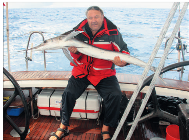
Где-то в Атлантике.

важно для него. И по себе знал, чем такая информация могла обернуться для Фортова в служебном плане. Поэтому впервые рассказал об этом журналистам только в день его смерти. Было бы неправильно хранить в секрете столь важную