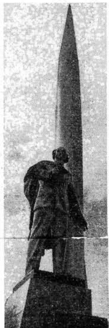
Калуга. Памятник К. Э. Циолковскому.