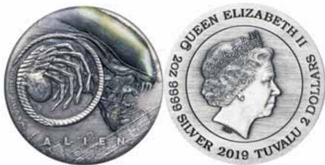
Рис. 7. Тувалу – 2 доллара 2019 г. (уникальная памятная коллекционная монета «Чужой» (тираж 1500 шт.))

25 мая 1979 г. в США состоялась премьера научно-фантастического фильма ужасов «Чужой» (англ. Alien ) режиссера Ридли Скотта (США/Великобритания, 1979), который десятилетиями оставался своеобразным объектом для подражания у создателей космических ужастиков. Он же стал и звездным часом для знаменитой актрисы Сигурни Уивер, сыгравшей главную роль (Эллен Рипли). Помните, насколько реалистично она «боялась» инопланетного монстра, приблизившего к ней вплотную свою жуткую личину?!