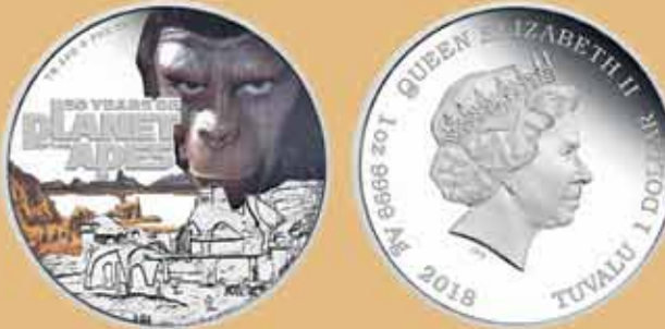
Рис. 3. Тувалу – 1 доллар 2018 г. (монета к 50-летию юбилею экранизации «Планеты обезьян»)