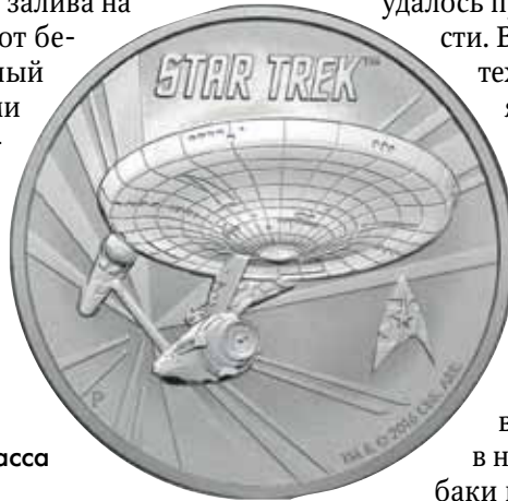
Рис. 12. Тувалу 1 доллар 2016 г. (Энтерпрайз (NCC-1701) — вымышленный звездолёт Звёздного флота класса «Конституция»)