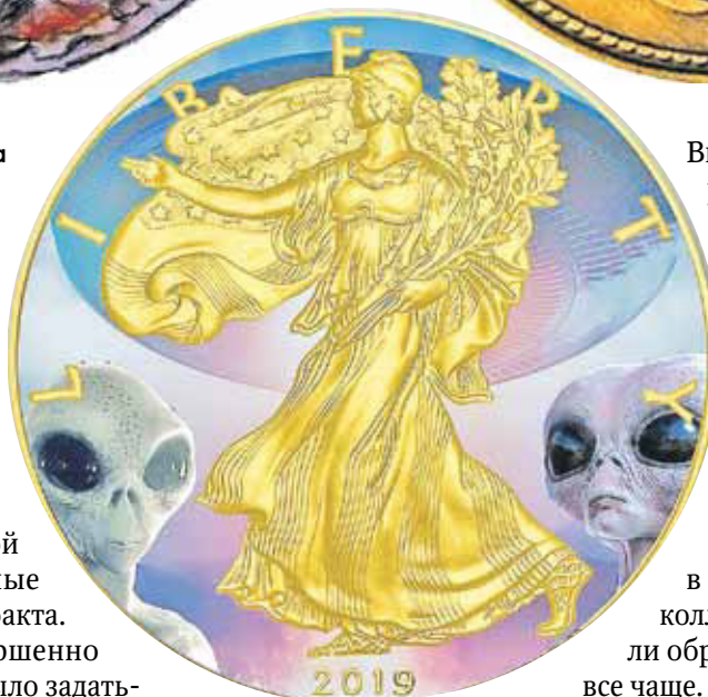
Рис. 16. США 1 доллар 2019 г. «Шагающая Свобода» (коллекционный вариант с пришельцами)

тиками бросились наперебой выдвигать самые невероятные версии происхождения артефакта. Однако спор этот был совершенно ни к чему! Ведь достаточно было задать-ся вопросом, как так получилось, что на аверсе монеты надпись сделана на латыни, а на реверсе — на древнегреческом? При этом сюжет лицевой стороны явно позаимствован с хорошо известных европейских токенов XVI–XVII вв., а бюст «инопланетянина» на обороте — античный по стилю. Ну а чуть позже появилось и опровержение загадочной находки. Как выяснили сетевые «детективы», анонимные