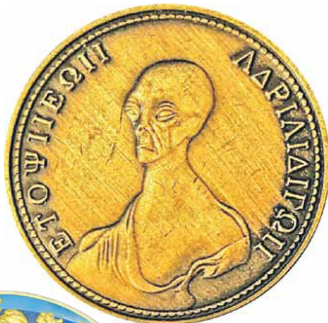
Рис. 14. «Аномальная» монета из Египта (рисунок автора)