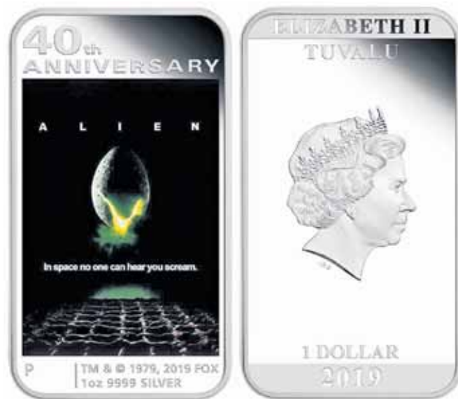
Рис. 9. Тувалу – 1 доллар 2019 г. (тираж 5000 шт.)