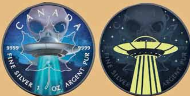
Рис. 5. Канада – 5 долларов 2018 г. («НЛО» похищает человека» на монете из серии «Кленовый лист», в темноте изображение светится)

на котором указаны номинал ( иногда также содержание ценного металла ), год чеканки и название страны, под эгидой которой он выпущен. То есть государство как бы гарантирует, что монета – это официальное средство платежа. В случае с коллекционными монетами это действительно лишь отчасти или с оговоркой. Потому как малотиражные выпуски таких дензнаков не предназначены для обращения ( как, впрочем, и инвестиционные, да и большинство памятных ). Да и их принадлежность к заявленной «стране-эмитенту» порой чисто символическая.