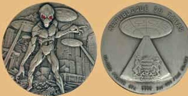
Рис. 4. Чад – 10 000 франков 2018 г. (качество чеканки Antique)