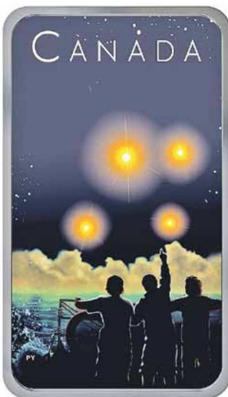
Рис. 10. Канада 20 долларов 2019 г.