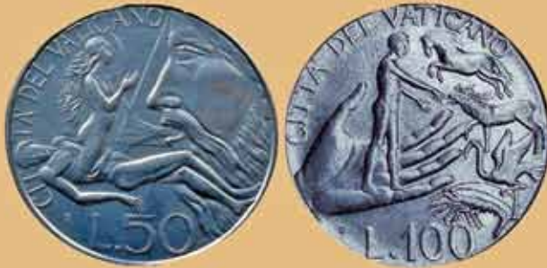
Рис. 2. Ватикан – 50 и 100 лир 1988 г. (монеты «Бог создает Еву» и «Адам дает имена животным»)