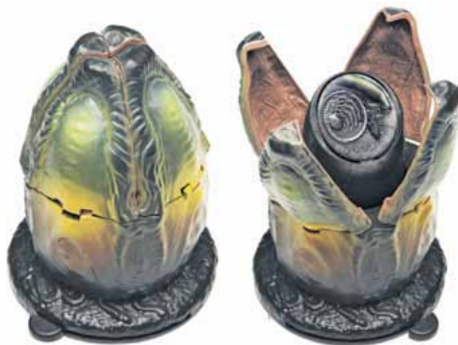
Рис. 8. Тувалу – футляр для монеты «Чужой»