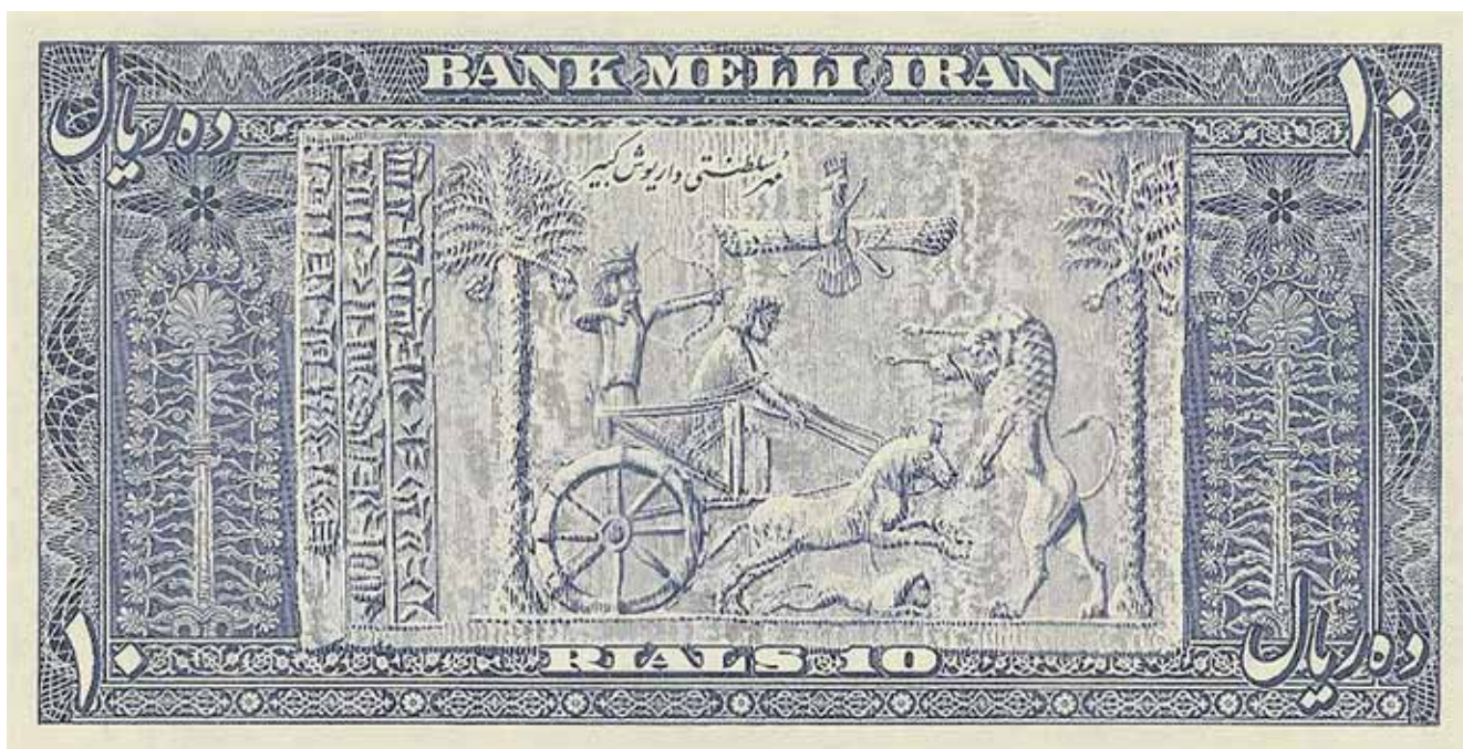
Рис. 1. Иран – 10 риалов 1951 г. (Божество-создатель Ахурамазда (над головой охотящегося царя) на оттиске с древней цилиндрической печати)

Но для начала следует напомнить, что же такое монета. В определенном смысле это государственный символ. Ведь это в первую очередь денежный знак,