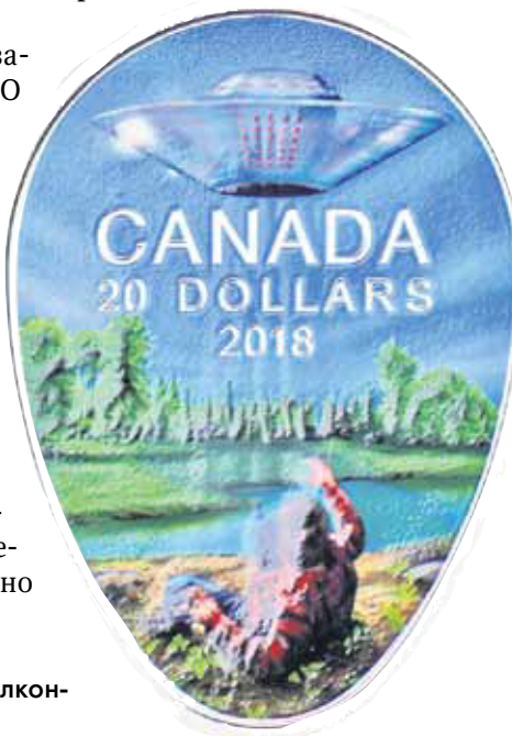
Рис. 13. Канада 20 долларов 2018 г. — (происшествие в Фалкон-Лейк 20 мая 1967 г.)

друг друга так, будто загадочный объект имел прямоугольную форму. Выходит, автор дизайна монеты лишь воплотил какую-то из своих фантазий. Уж не под влиянием ли легендарного образа звездолёта «Энтерпрайз» (NCC-1701) из сериала «Звёздный путь»? Рис. 12.