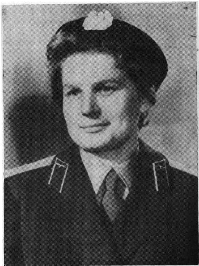
Герой Советского Союза летчик-космонавт СССР В. В. ТЕРЕШКОВА.