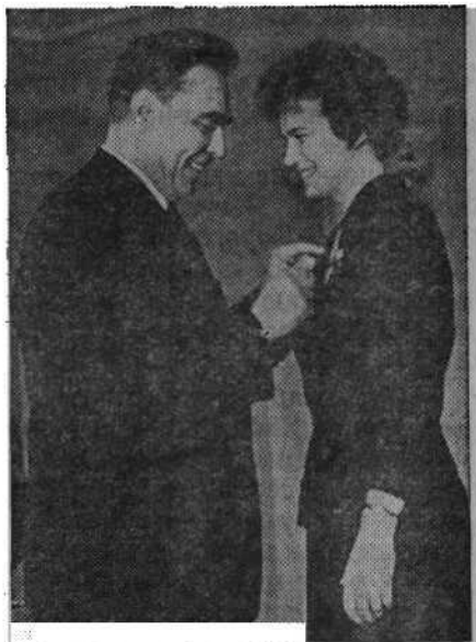
Председатель Президиума Верховного Совета СССР Л. И. Брежнев прикалывает Героине Золотую Звезду и орден Ленина.

День и ночь за иллюминатором проплывали материка с выводками островов. Я вела тщательное наблюдение за всем , что окружало меня. Записывала в бортовой журнал. Строго по программе занималась вестибулярными пробами, самоконтролем за физиологическим состоянием, физзарядкой. Следила за показаниями приборов. Докладывала Земле. Принимала пищу, спала. Правда, однажды «прихватила» лишнего. Уснула так, что «Заре» пришлось будить . Чего греха таить , неловко получилось. Докладываю: мол, так и так, малость не по программе получилось. Извините. Исправлюсь.