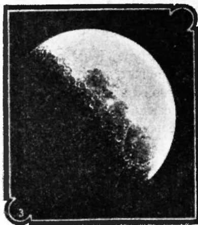
Рис. 1. Температура на светлой половине Луны достигает 120^{\circ} ; на темной—падает до минус 160^{\circ} .

Невольно возникает вопрос: почему же на Земле, расстояние которой до солнца практически то же, что и для Луны, мы