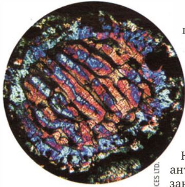
Микрофотография шарика-хондры диаметром 0,4 мм из минерала оливина в 14-килограммовом каменном метеорите Моораби (Австралия), который на 92% состоит из хондр. Такие каменные шарики не встречаются в земных породах, но типичны для 90% каменных метеоритов, называемых поэтом хондритами