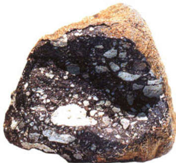
Каменный метеорит ALH 81005, прилетевший с Луны. Найден у холмов Аллан-Хиллс в Антарктиде. Размер — около 3 см