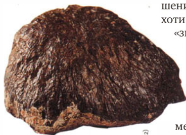
Каменный метеорит Лос-Анджелес, прилетевший с Марса. Поперечник — 9 см