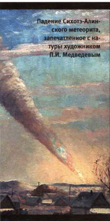
Падение Сихотэ-Алинского метеорита, запечатленное с натуры художником П.И. Медведевым

Астероид Фобос диаметром 25 километров, сходный по составу с каменными метеоритами, образовался около 4,5 миллиарда лет назад и стал постепенно перемещаться из внешней ►