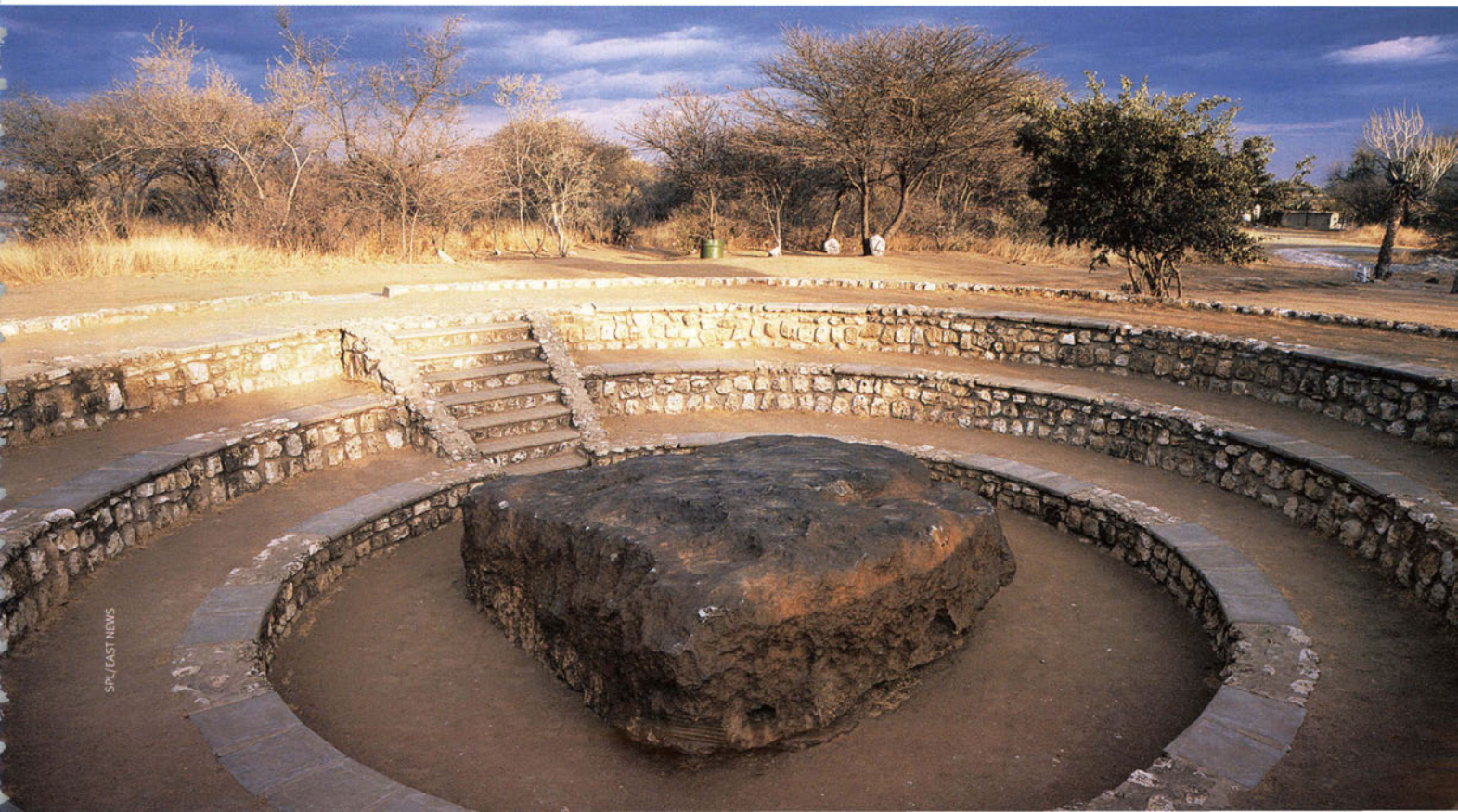
60-тонная железная глыба крупнейшего в мире метеорита Гоба — национальное достояние Намибии