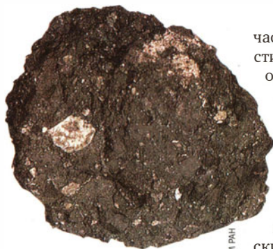
Кайдун — метеорит, прилетевший с Фобоса, спутника Марса. Размер — около 8 см