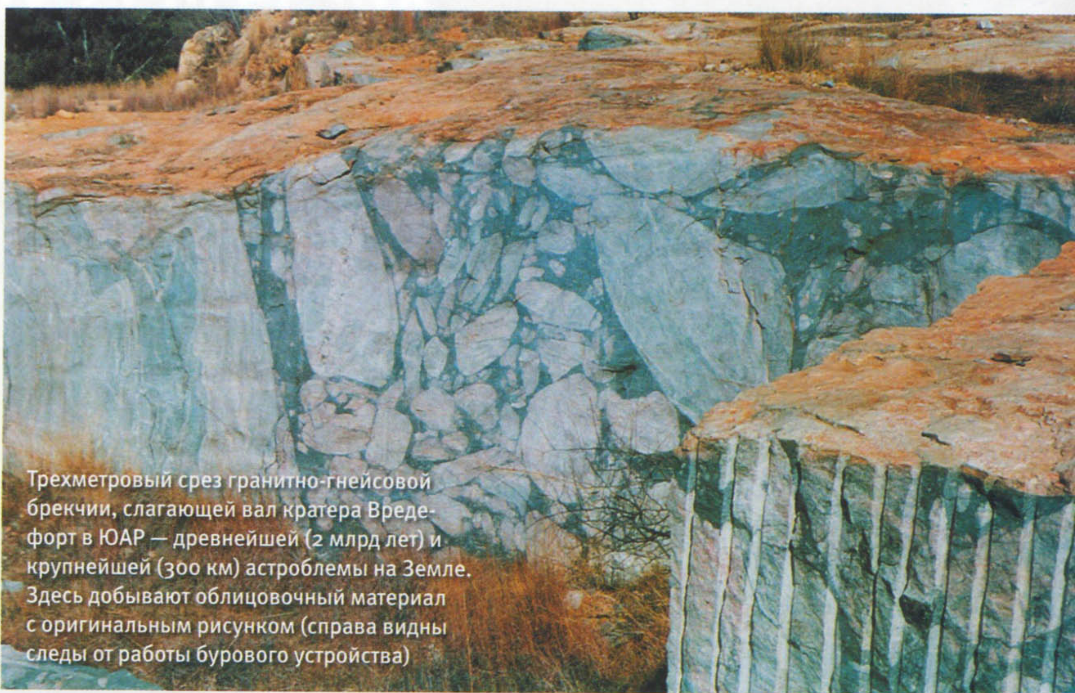
Трехметровый срез гранитно-гнейсовой брекчии, слагающей вал кратера Вредефорт в ЮАР — древнейшей (2 млрд лет) и крупнейшей (300 км) астроблемы на Земле. Здесь добывают облицовочный материал с оригинальным рисунком (справа видны следы от работы бурового устройства)

Времени образования этого кратера соответствуют глинистые отложения, в которых содержание крайне редкого на Земле иридия в 15 раз выше фонового. Этот иридиевый слой как раз служит границей, отмечающей окончание мелового геологического периода, для которого