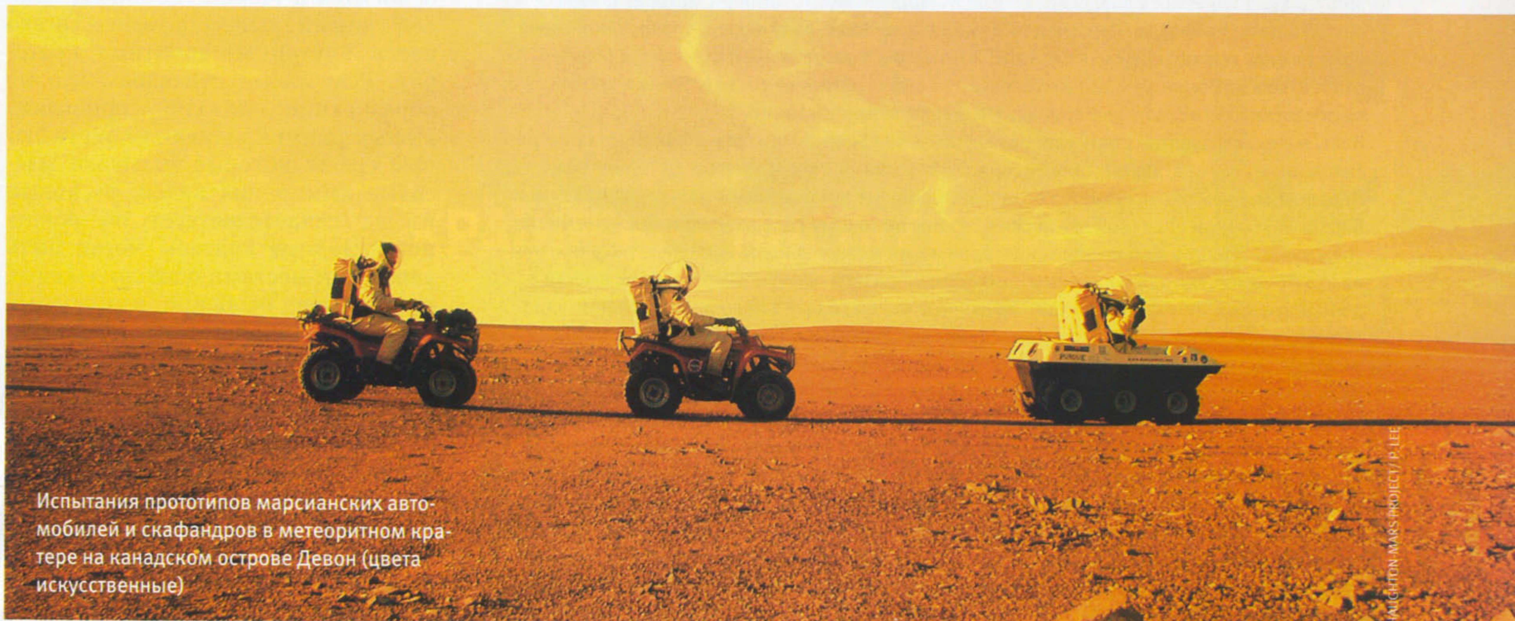
Испытания прототипов марсианских автомобилей и скафандров в метеоритном кратере на канадском острове Девон (цвета искусственные)

метеоритов, стали теми оазисами, где возникла и начала развиваться жизнь на нашей планете. Американско-канадская научная группа несколько лет работала в метеоритном кратере Хогтон на острове Девон в Канадской Арктике. Этот кратер диаметром 24 километра хорошо выражен в рельефе. В условиях холодной арктической пустыни в нем почти нет растительности, что облегчает геологическое изучение. Кроме того, ландшафт и климатические условия здесь в определенной степени напоминают марсианские, и поэтому прямо внутри кратера были установлены легкие каркасные домики-▶