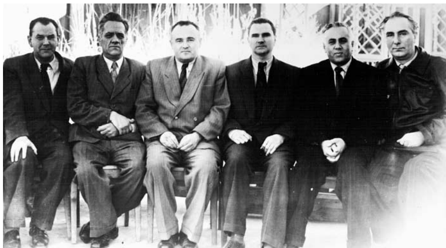
Фото 5. Техническое руководство по испытаниям ракеты Р-7 (слева направо): Рязанский М.С., Пилюгин Н.А., Королёв С.П., Глушко В.П., Бармин В.П., Кузнецов В.И.

Но если мы всё же хотим дать название усечённому варианту, то должны обратиться к вышеприведенному Постановлению: на снимке из шести человек представлено «Техническое руководство по испытаниям ракеты Р-7» (см. фото 5).