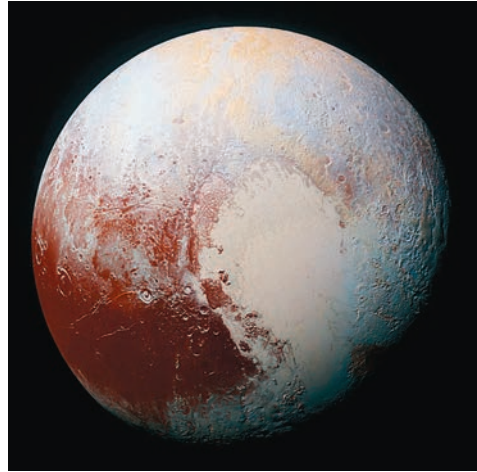
Плутон – дальний рубеж Солнечной системы. Равнина, очертаниями напоминающая сердце, была позже названа Область Томбо в честь астронома-первооткрывателя Плутона Клайда Томбо. Фото получено с помощью приборов на борту AMC New Horizons (США) 13 июля 2015 г.

Несмотря на то, что в повседневной речи жаргонизм “ракетная наука”, rocket science , по-прежнему означает что-то очень сложное и трудоемкое (по-русски сейчас скажут “матан!..”), наука как таковая, то есть собственно космические исследования, занимают в мировых программах не такое большое место, как могло бы показаться, и существенная доля инноваций приходится на прикладные космические системы (которые раньше называли народнохозяйственными). На март 2019 г. американский “Союз обеспокоенных ученых” ( Union of Concerned Scientists ) в своей популярной общедоступной базе данных насчитал чуть более 100 космических аппаратов научного назначения из примерно 2060 спутников разных стран и народов. Два-три десятка земных автоматов на Марсе, Луне и в различных уголках