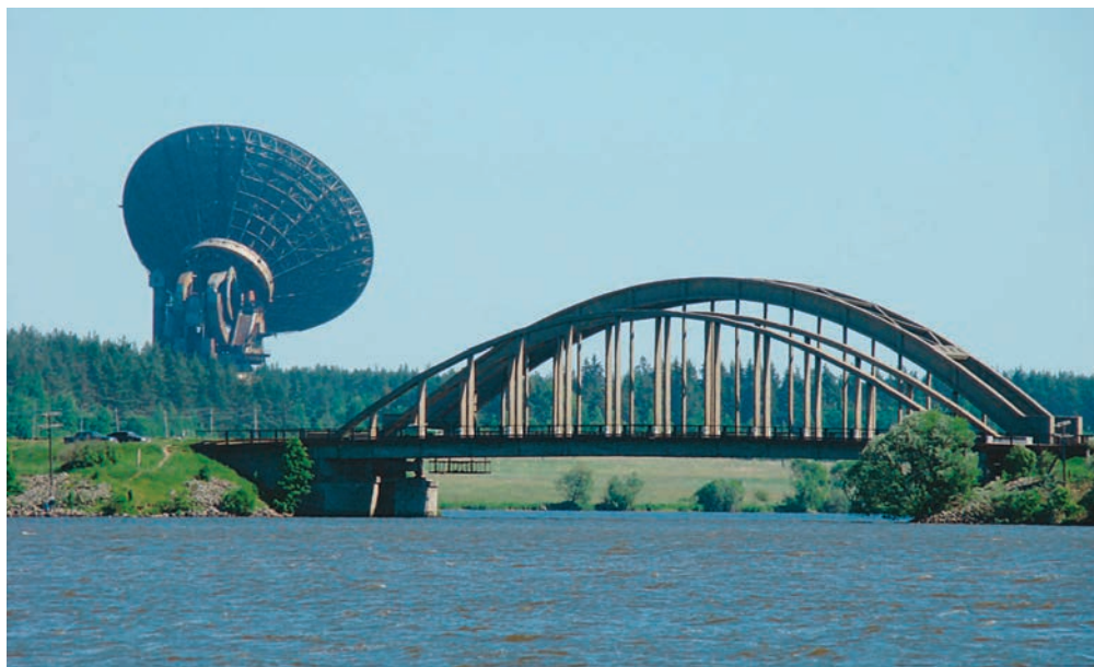
Освоение космоса как мост к новым берегам. Калязинская радиоастрономическая обсерватория и мост через реку Жабня

Первый переход состоялся в 1970-х – 1980-х гг. Космическая связь к тому моменту “созрела” до полноценного окупаемого бизнеса, связанного с трансляцией телепередач и организацией межконтинентальной телефонной связи. Тогда была приватизирована первая международная компания спутниковой связи “Интелсат” ( Intelsat ), появился европейский спутниковый гигант SES, а консорциум европейских компаний вывел на рынок ракеты-носители семейства “Ариан” ( Ariane ), впервые