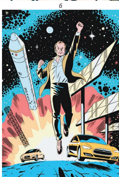
Два времени – два образа – два героя (а, б): советский космонавт и Илон Маск. Рисунок (б): R. Kikuo Johnson для Businessweek