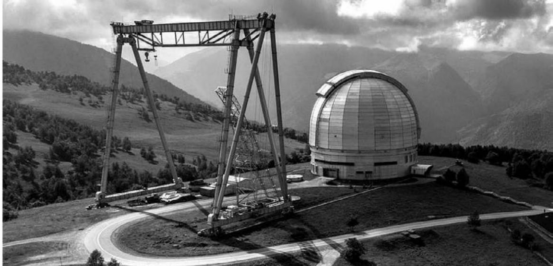
Большой телескоп азимутный

Из 34 астрономических исследовательских структур России 27 имеют собственную инфраструктуру для проведения наземных астрономических наблюдений. Это оптические телескопы, радиотелескопы, полигоны, специальные аппаратные комплексы и другое. Объектов со статусом Уникальная научная установка имеется 11, часть из них — «Центры коллективного пользования». Это немало, однако в последние несколько десятков лет в России развитие наблюдательных средств астрономии почти не происходило. Последнее крупное вложение было сделано в 70-е годы прошлого века: тогда построили самый большой на то время оптический телескоп БТА и кольцевой радиотелескоп РАТАН-600 диаметром 600 метров. Сегодня БТА замыкает вторую десятку работающих в мире инструментов. Недавно было проведена ре-