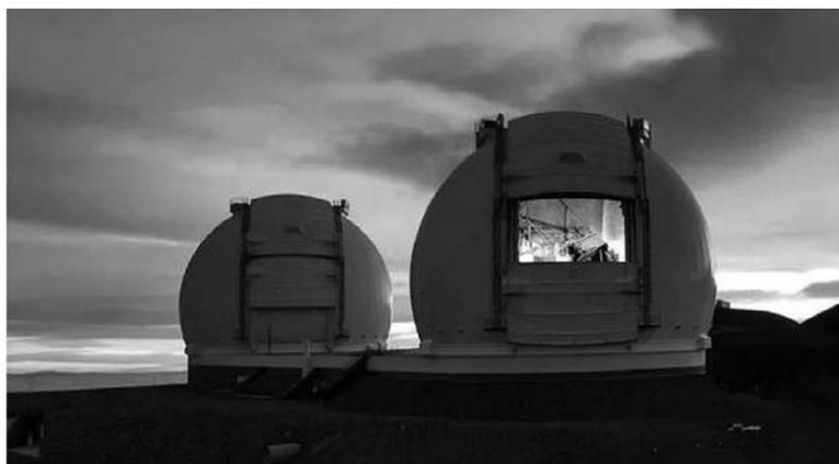
Телескопы Кека на Гавайях

ставрация главного зеркала телескопа, но качество выполненных работ пока не определено. В ряду оптических телескопов с апертурой крупнее 2 метров, кроме БТА, работают 2,6-метровый телескоп Крымской астрофизической обсерватории РАН, 2,5-метровый телескоп Кисловодской обсерватории МГУ имени М. В. Ломоносова и 2-метровый телескоп совместной российско-украинской обсерватории на пике Терскол. Общая площадь зеркал российских телескопов составляет около 42 квадратных метров или 3 процента от площади зеркал оптических телескопов в мире. Еще есть две сети малоапертурных (50 сантиметров) телескопов: роботизированная сеть «Мастер» (ГАИШ МГУ имени М. В. Ломоносова), основная за-